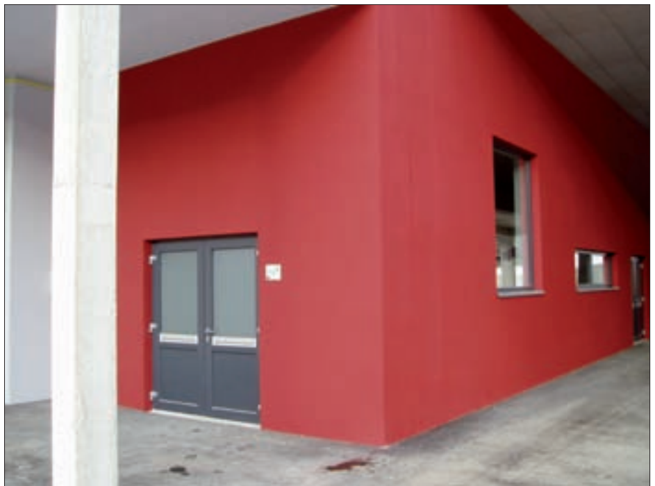
Die Obstverarbeitungsanlage besteht aus Waschanlage, Mühle, Bandpresse, Grobsieb, zwei Edelstahl-Zwischenbehälter, Pasteur und Bag-In-Box Abfüller.

Nachdem 2009 ein ruhiges Jahr in Bezug auf den Feuerbrand war, heißt