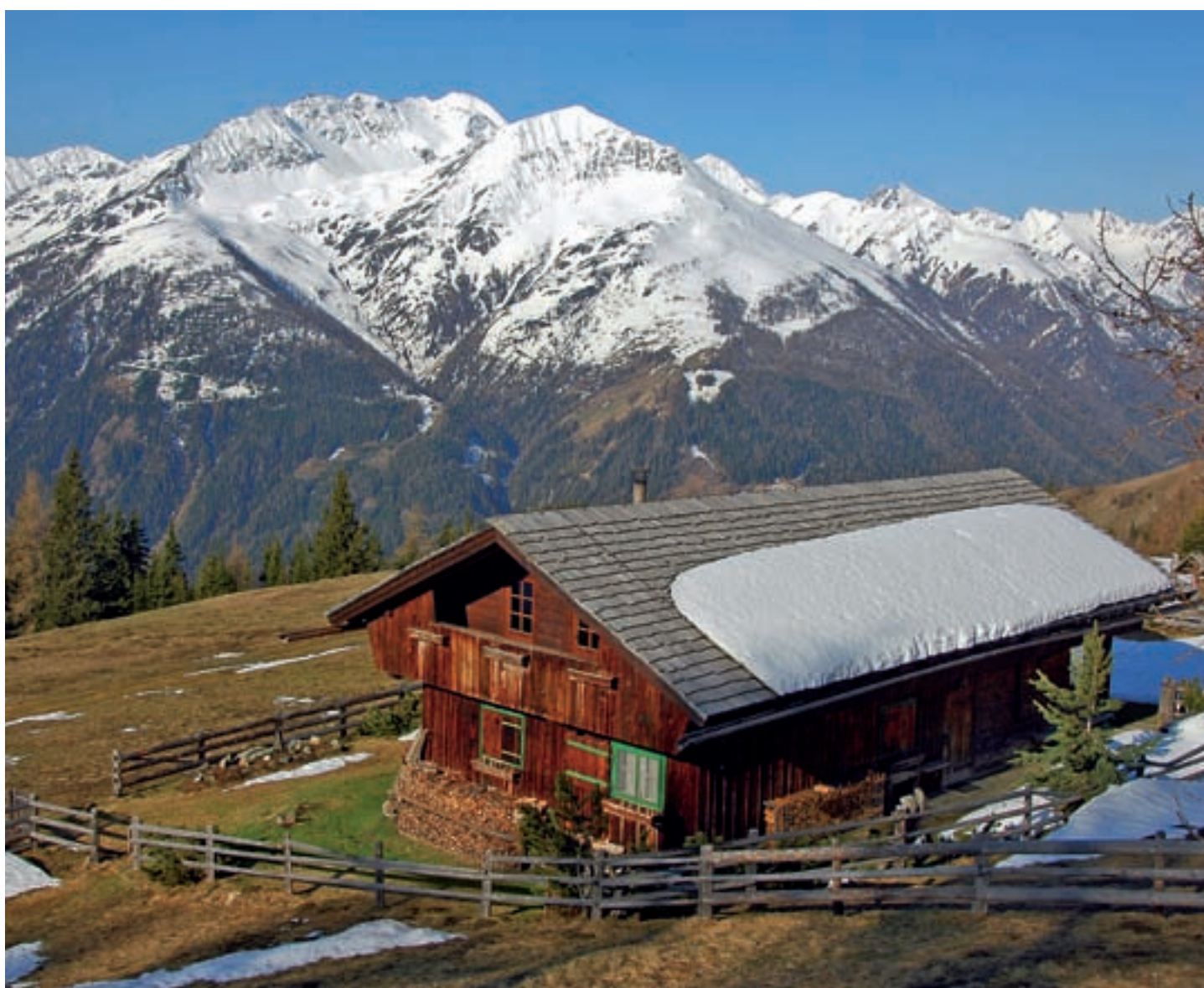
Gotschaun im Frühjahr.