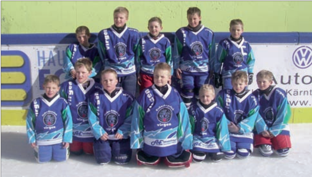
Ein Teil unserer Nachwuchsmannschaft beim U 11-Turnier in Huben.

unsere Super-Minis (bis acht Jahre), die in insgesamt vier Begegnungen an die sechzig Mal den Puck im gegnerischen Tor versenkten und somit den internen „Super-Mini-Meistertitel“ bravourös verteidigten.