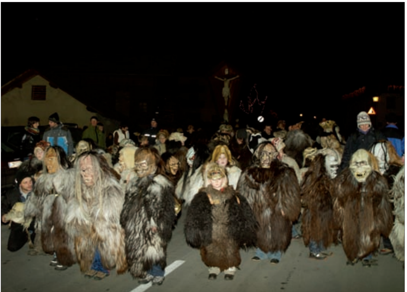
Zahlreiche „Kinder-Kleibeife“ zogen am 28. November durch unseren Dorfkern.