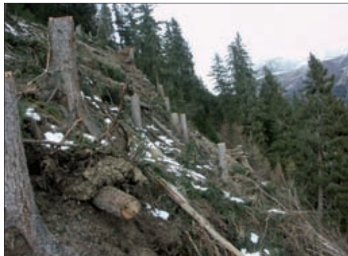
Seit 1990 wurden zur Verbesserung des Schutzwaldes zahlreiche forstliche Maßnahmen getätigt.

pflege und Durchforstung beträgt ca. 80 % der Nettokosten. Bei technischen Maßnahmen wie Seilung und Verpflockungen variiert der Fördersatz zwischen 20% – 80%. Um die Bewirtschaftung der Wälder zu erleichtern sind auch Forstwege geplant.