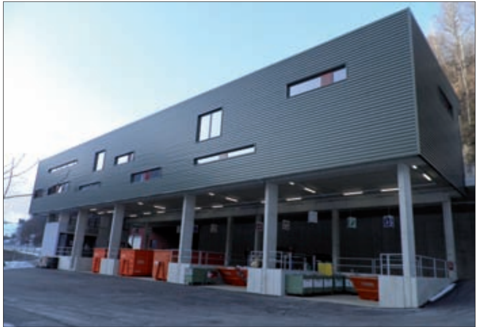
Durch den neuen Bau- und Recyclinghof wurde das Service für die Bürger im Bereich Umwelt sowie Abfallwirtschaft stark verbessert.