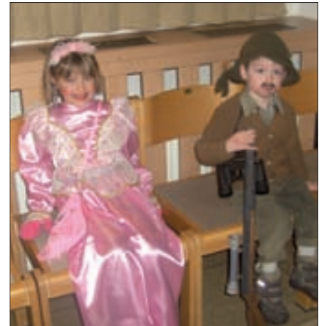
Fast 100 Kinder besuchten heuer mit ihren Eltern die Flohparty im Pfarrsaal.

(spendiert von einigen Müttern – vielen Dank dafür!) in der Oase.