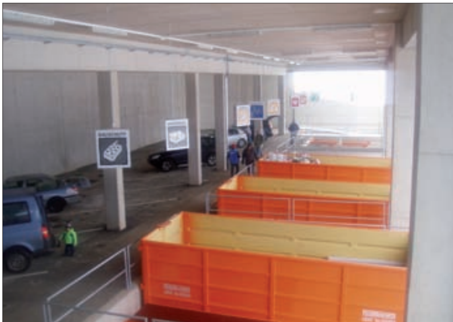
Der neue Recyclinghof wurde so gebaut, dass die Bürger ihre Abfälle und Wertstoffe schnell, bequem und ohne Parkstau entsorgen können.

Im Frühjahr 2010 wird ein zentraler Häckseldienst für die ordnungsgemäße Entsorgung der anfallenden