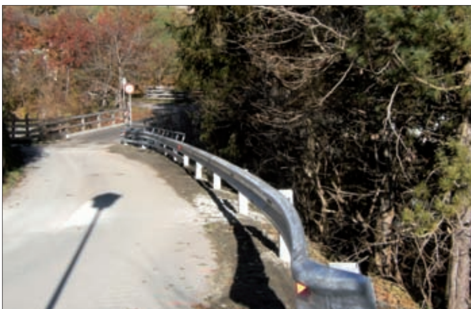
Die neu errichtete Leitschiene im Bereich des Verbindungsweges südlich der Hofstelle vlg. Fritzer in Mitteldorf.

troffenen Grundeigentümern, mit Unterstützung der Wildbach- und Lawinerverbauung, der Agrargemeinschaft Niedermauern und der Gemeinde, im Herbst des Vorjahres saniert.