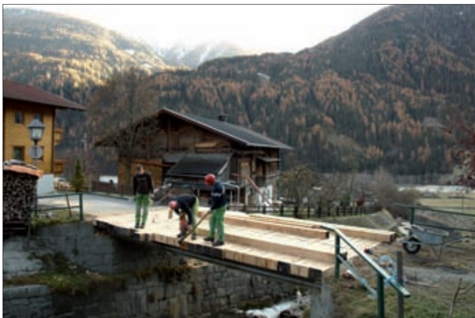
Die Taller-Brücke in Niedermauern wurde im Herbst des Vorjahres saniert.

Die äußerst desolante Taller-Brücke in Niedermauern wurde von den be-