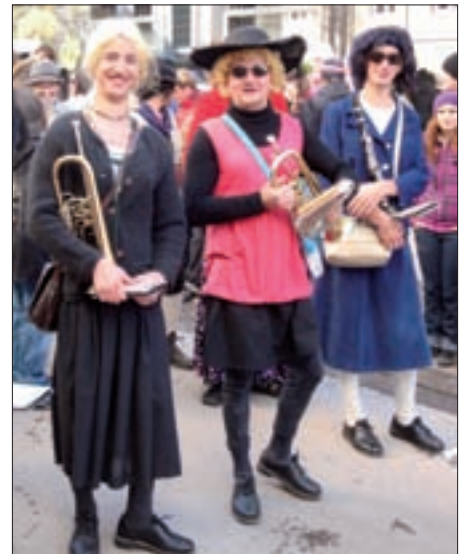
Die Virger MusikantInnen sorgten mit ihren Darbietungen für Heiterkeit beim Faschingsumzug in Matrei.