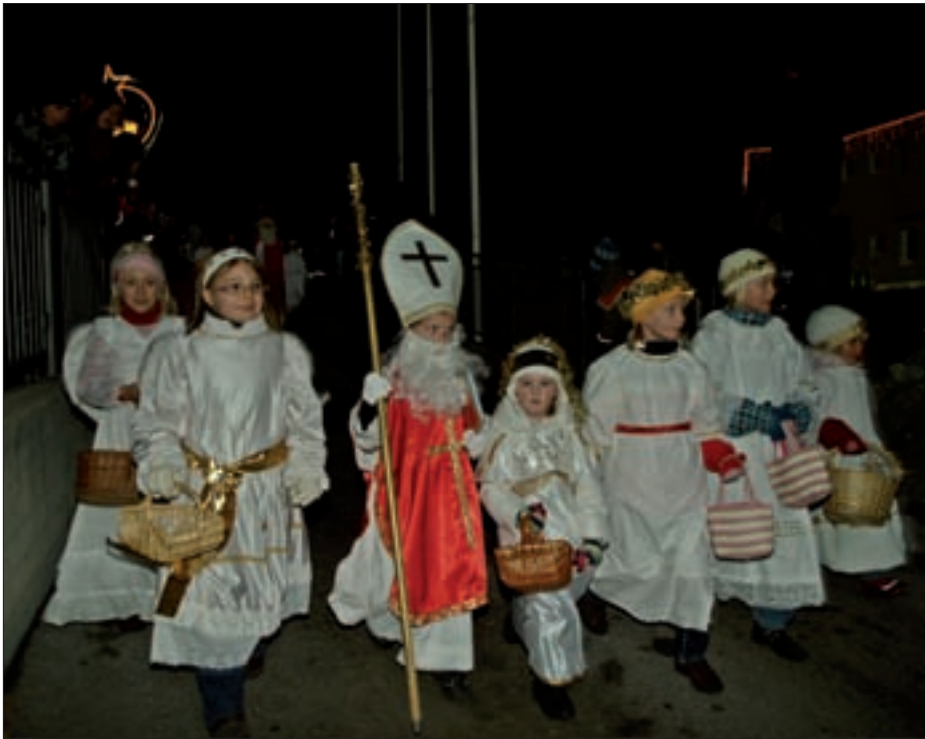
Der „kleine“ Nikolaus – gefolgt von einem Teil seiner Engelschar.

Der Kinderklaubauf-Einlauf ging am 28. November 2009 bereits zum achten Mal über die Bühne.