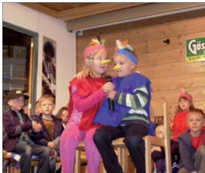
Die Kinder führten das Stück „Die Vogelhochzeit“ beim Muttertagsfrühstück im Pfarrsaal auf.

Neben dem gewohnten Tagesablauf gab es auch immer wieder Höhepunkte im Laufe eines Kindergarten-Jahres, wie Muttertagsfrühstück im Pfarrsaal, Besuch des Polizisten, Teilnahme bei der Dorfreinigungsaktion, Wandertag usw.