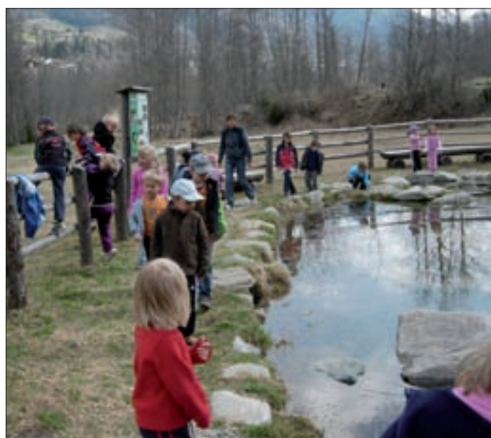
Im Frühjahr besuchten die Kindergartenkinder das Biotop. Dort gab es viel zu entdecken.