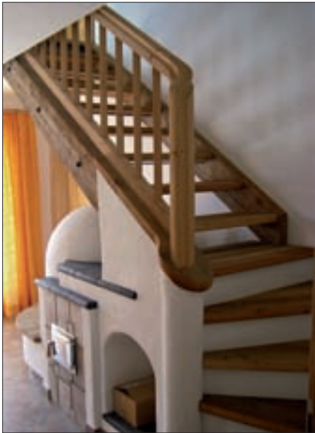
Die Firma FORM UND MASS setzt auf „Wertarbeit“ und Langlebigkeit der Arbeiten.

Dinge des persönlichen Bereichs sollten langlebig sein und auch morgen noch einen Wert darstellen. Möbel von FORM UND MASS aus Meisterhand leisten dazu einen besonderen Beitrag. Das Arbeitsgebiet ist vielfältig und umfasst nahezu alle Bereiche der Tischlerei, von der Renovierung alter Baubestände über Einrichtungen bis zu modernem Möbeldesign.