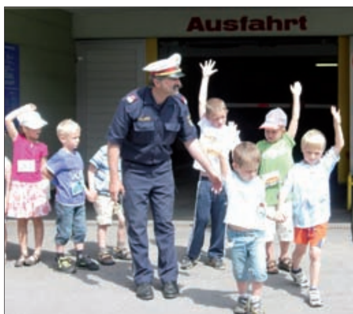
▲ Wandertag der Kindergartenkinder. Der Polizist zeigte den Kindern, wie man ► sicher die Straße überquert.