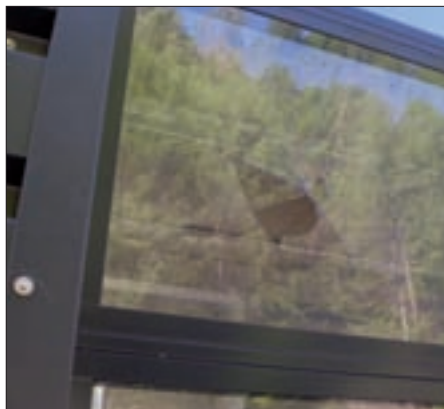
Diese Scheibe im neuen Bauhof wurde mit einem Stein eingeschossen.

Mit dem Neubau des Bauhofes wurde nun stattdessen ein CAD-Arbeitsplatz eingerichtet, der den Arbeitern ermöglicht, die Aufzeichnungen künftig im Büro zu machen.