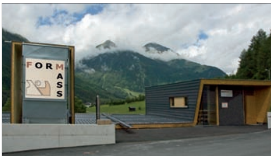
▲ Die Werkstatt mit dem Eingang zum Büro. Die neue Halle bietet ausreichend Platz für rationelles Arbeiten. ►