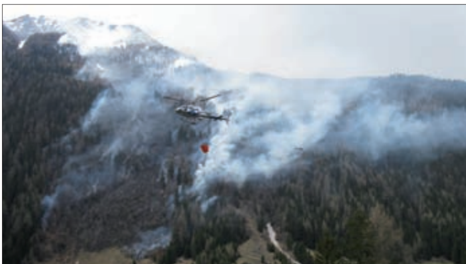
Am Samstag den 24. April wurde die Freiwillige Feuerwehr Virgen zu einem Waldbrand in Kals zu Hilfe gerufen, der sieben Tage lang andauerte.