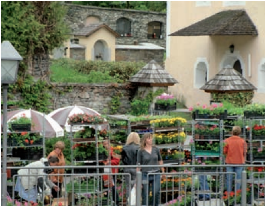
Die Firma Unterscheider veranstaltete am 26. Mai wieder einen Blumenmarkt auf dem Kirchplatz in Virgen.