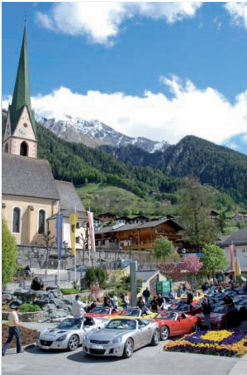
Das Opel Speedster & GT Treffen fand heuer bereits zum neunten Mal statt.

Aktuelle Zimmerfreimeldungen werden immer freitags vom Infobüro Virgen auch an das Infobüro nach Matri i. O. weitergeleitet und beantwortet.