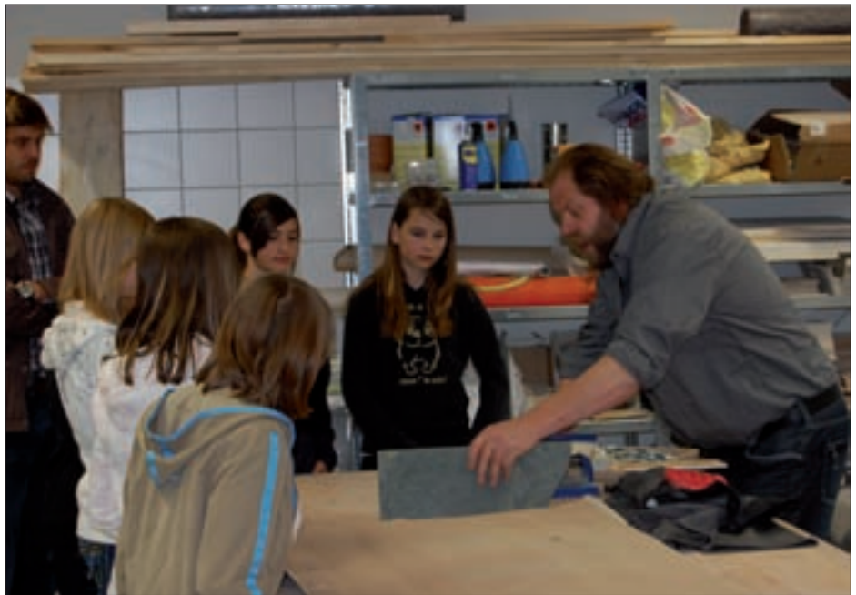
Beim Berufsinformationstag wurden den interessierten Jugendlichen unter anderem verschiedene Lehrberufe anhand von praktischen Arbeitsschritten vorgestellt.

„Nicht studieren um jeden Preis, sondern die Chancen wahrnehmen, die