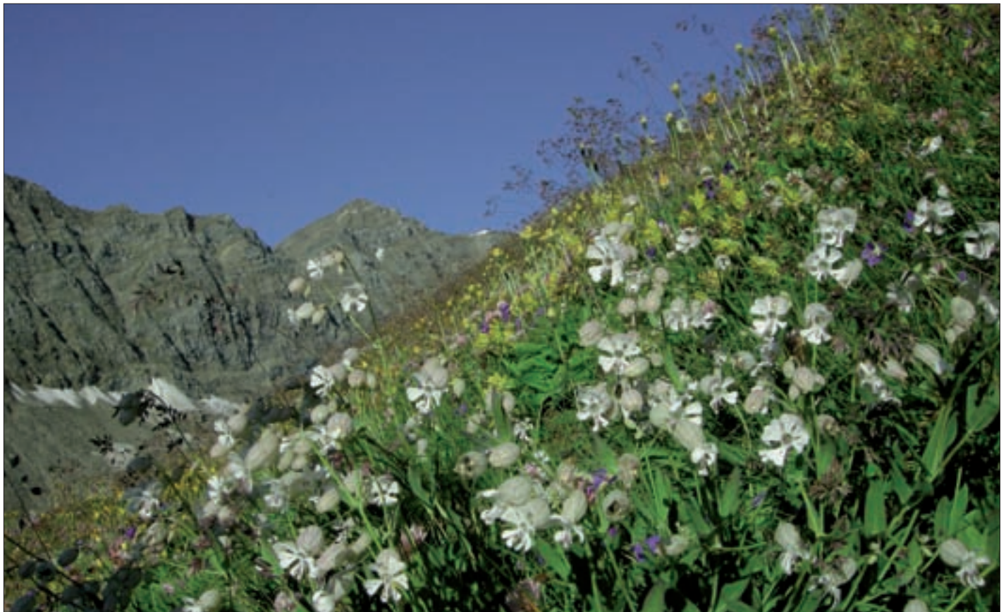
Almwiese im Frosnitz.

Man kann wohl heute einfach nicht mehr erwarten dass Botaniker so arbeiten wie einst David Hoppe, der um 1820 aufgrund seiner extrem guten körperlichen Konstitution einheimische Bergführer zur Verzweigung brachte, weil er Schlechtwettereintritte ganz einfach ignorierte und hoch oben in den Wänden des Großglockners trotz heftiger Stürme begeistert botanisierte und danach überschwengliche Berichte darüber schrieb.