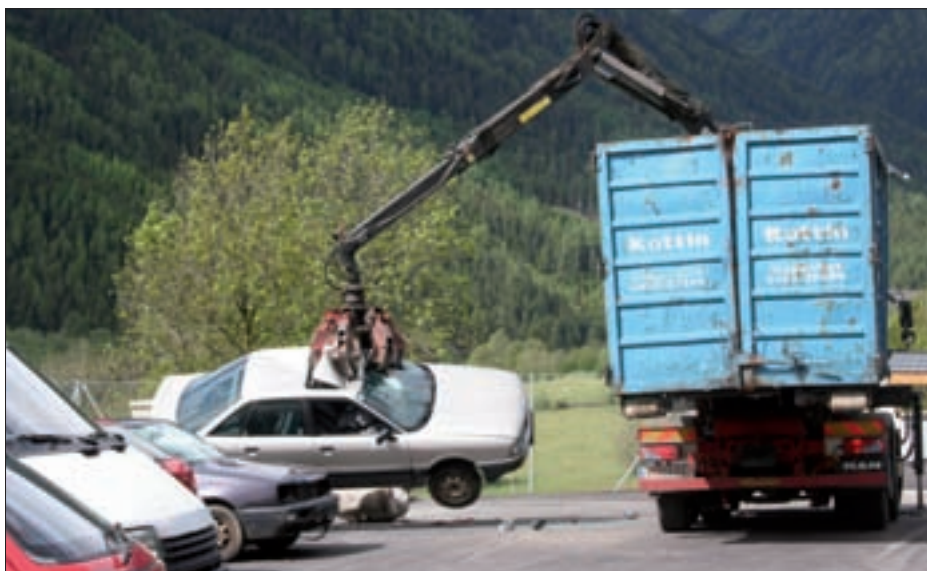
Zwölf Autos wurden bei der Aktion entsorgt.

Auch heuer fand wieder eine Sammelaktion der Autowracks, die das Orts- und Straßenbild beeinträchtigen, statt. Die Autos konnten vom 26. bis 29. Mai 2010 am zentralen Sammelplatz beim neuen Recyclinghof abgestellt werden. Durch diese Aktion konnten wieder zwölf Altagos kostengünstig entsorgt werden.