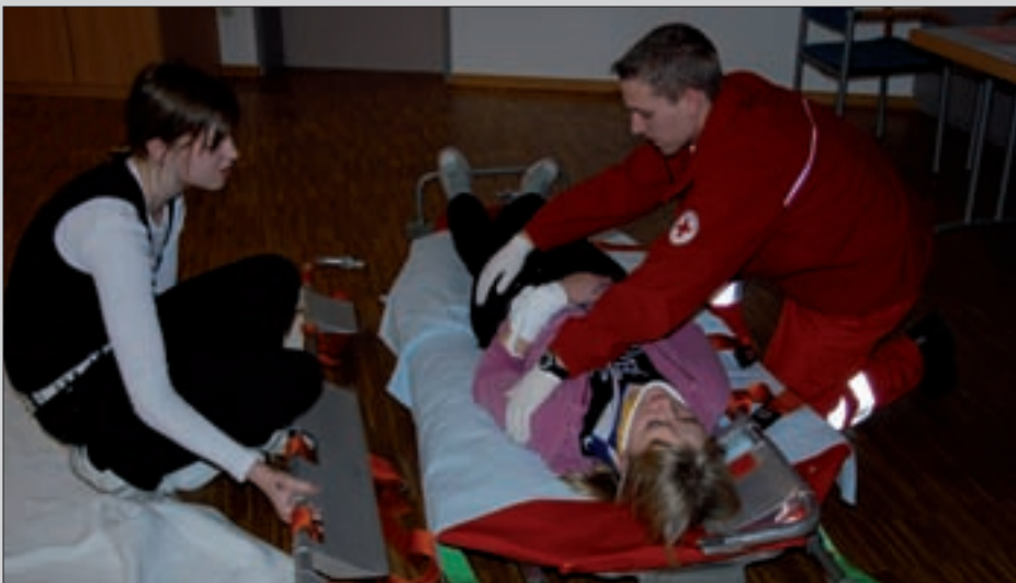
Nur das Hand-in-Hand-Arbeiten lässt die Ersthelfer im Notfall entsprechend handeln und rechtzeitig eingreifen.

Österreichisches Rotes Kreuz, Landesverband Tirol, Bezirksstelle Osttirol