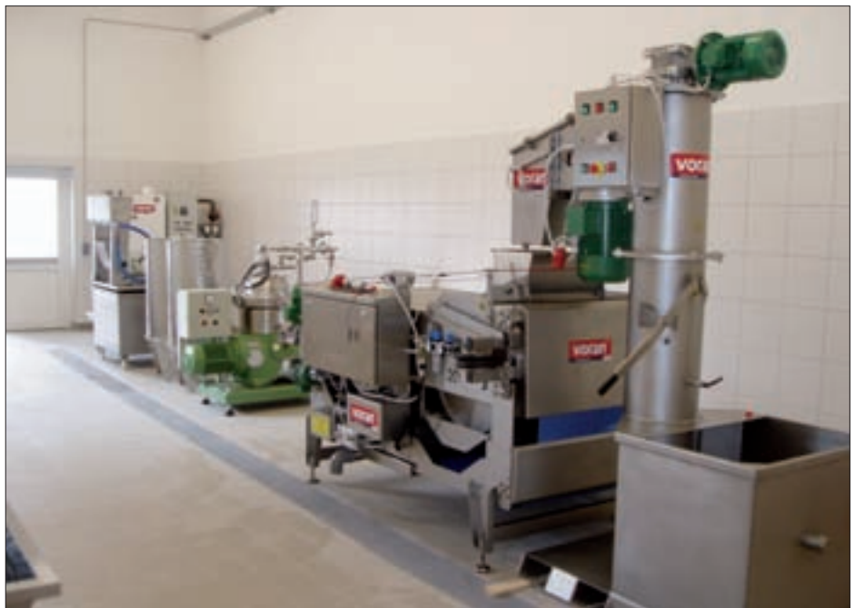
Die neue Obstverarbeitungsanlage.

Wer die Obstpressanlage unterstützen möchte, kann dies mit einem Beitrag auf das Konto des Obst- und Gartenbauvereines Virgental Konto