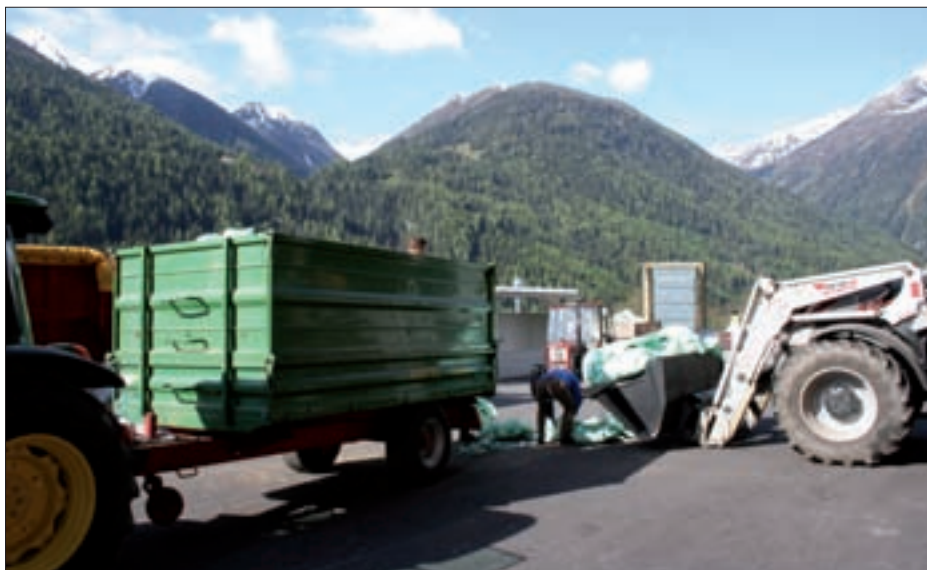
Die Foliensammlung am 19. Mai erfreute sich reger Beteiligung.

Die Verschmutzung der Felder und Spazierwege durch Hundekot ist ein schwerwiegendes Problem. Denn die Haufen sind nicht nur Ekel erregend,