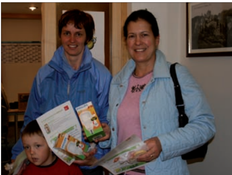
Im heurigen Frühjahr wurden 396 Energiesparlampen, zur Verfügung gestellt von der TIWAG, an die Virger Haushalte ausgegeben.

Verdichtete Bauweise und Eigenheime werden besser gefördert, ebenso ist die Wohnbeihilfe leicht angehoben worden. Die bislang absoluten Einkommensgrenzen sind durch eine Einschleifregelung ergänzt. Für Darlehen nach dem Wohnhaussanierungsgesetz ist der Zinssatz ab dem 26. Jahr auf 3,5 % reduziert (früher 5 %). Der Einbau von PVC-freien Fenstern und Türen (z. B. Holzfenstern) wird als umweltfreundliche Maßnahme beson-