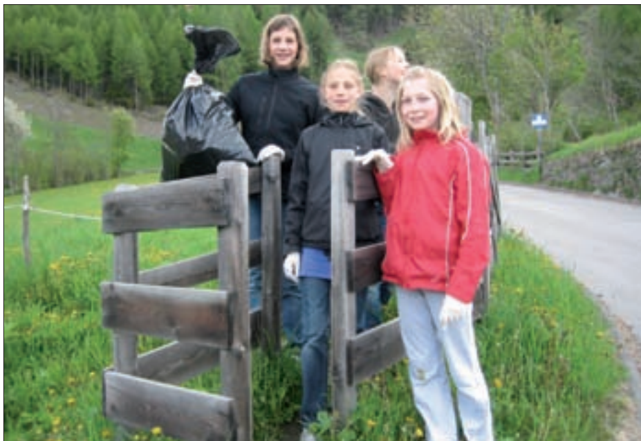
Bereits zum 18. Mal fand heuer die Dorfreinigungsaktion statt. Im Bild: Schülerinnen der Hauptschule mit ihrem gesammelten Müll.