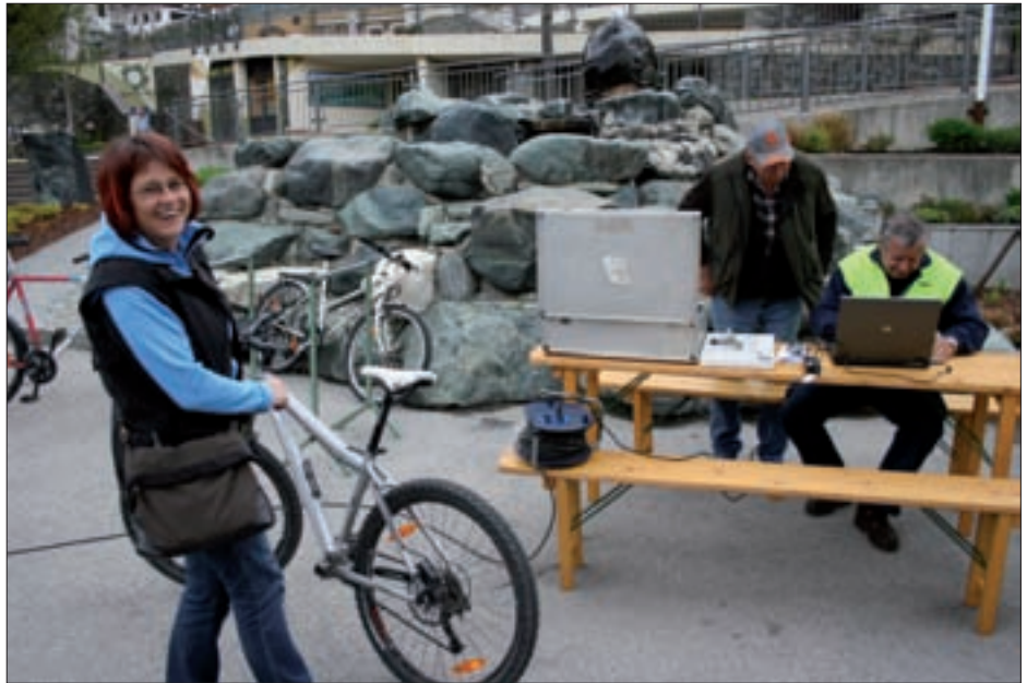
Beim ÖAMTC-Stand wurden Fahrradcodierungen durchgeführt.

In ganz Österreich informierten Gemeinden, Energieberatungsstellen, Betriebe und Schulen über Solaranlagen. Solarenergie ist die einfachste und logischste Form der Warmwasserbereitung und eine praktische Form von Klimaschutz. Fast 250.000 Haushalte setzen bereits auf die Sonne. Für ein Einfamilienhaus genügen vier bis sechs Quadratmeter Kollektoren, um zwei Drittel des Warmwassers zu erzeugen. Mit 15 bis 20 Quadratmetern kann die