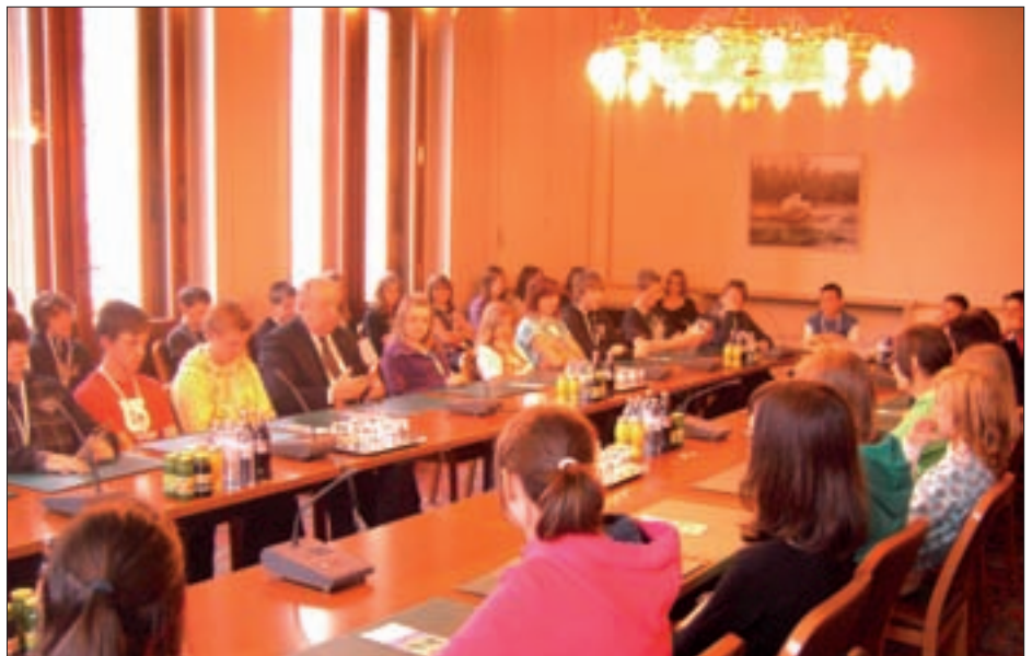
Die SchülerInnen der 4. Klassen Hauptschule im Österreichischen Parlament.

Im Rahmen der alljährlich für die 4. Klassen der HS Virgen stattfindenden Wienwoche, stand dieses Jahr