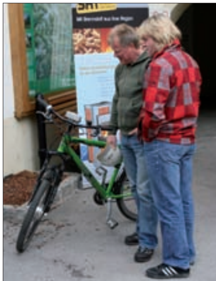
Die Virgener Kleinwasserkraftwerke stellten ihr Elektrofahrzeug für Probefahrten zur Verfügung.

Sonne einen wesentlichen Beitrag an Warmwasser und Heizung bereitstellen. Den Rest erledigt der Heizkessel.