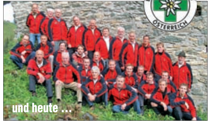
Ein Teil der Mannschaft im Jahr 2010.