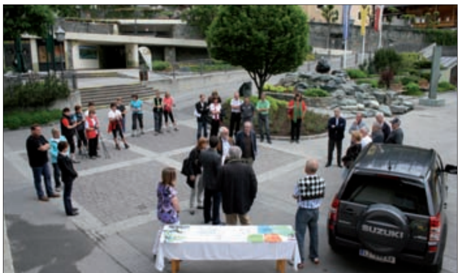
Auf dem Dorfplatz wurden der Jury die Projekte bzw. Initiativen Virgen mobil, das Virger Mobil mit freiwilligen FahrerInnen, die „Bischlmamm“ und die „Walkingarena Virgental“ vorgestellt.

Alle zwei Jahre wird der Europäische Dorferneuerungswettbewerb