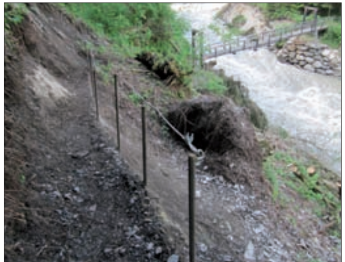
Mithilfe von Eisen- und Holzhalterungen sowie Erdaufschüttung konnte der Iselsteg wieder zugänglich gemacht werden.