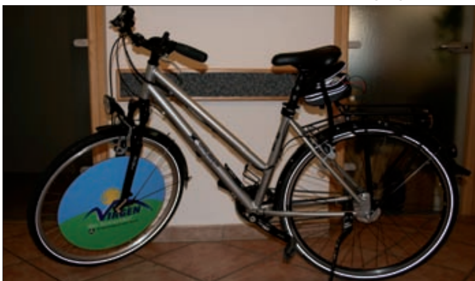
Elektrofahrrad der Gemeinde.