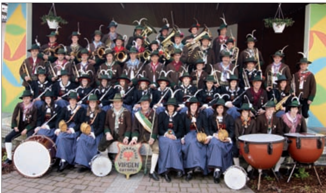
Die Musikkapelle Virgen.

Die Musikkapelle freut sich auf einen musikalisch herausragenden Sommer mit einem sehr abwechslungsreichen Konzertprogramm.