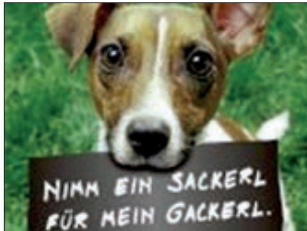
Die „Dog-Stationen“ in Virgen sind Sammelstellen für die vollen Kotbeutel.

sondern auch gefährlich für Rinder, Pferde und Schafe. Über den Hundekot wird der Erreger „Neospora caninum“, der die Krankheit Neosporose verursacht, übertragen – ein Verursacher von Totgeburten bzw. Verwerfungsfällen bei Rindern. Der Hund nimmt die Parasiten über das Futter auf. Die ausgeschiedenen Erreger sind sehr widerstandsfähig und können über mehrere Monate hinweg überleben und infektiös bleiben. Kühe und andere Nutztiere nehmen diese Erreger durch Gras, Heu oder über das Trinkwasser auf und bleiben ihr Leben lang infiziert. Der Erreger wird bei einer Trächtigkeit von der Kuh an das Kalb übertragen, was Tot- und Frühgeburten verursacht. Es gibt bis dato keine Impfung oder Entwurmung gegen Neosporose. Der Tiroler Bauernbund setzt in diesem Zusammenhang auf Aufklärung und appelliert an die Vernunft der Hundehalter. Informationen auf Tafeln bzw. der Verweis auf das Feldschutzgesetz sollen dazu beitragen. Dieses Gesetz sieht bei der Verschmutzung von Feldern (Feldfrevel) ein Strafmaß von bis zu 2.200 € vor. Jeder Halter eines Hundes hat laut Gesetz dafür zu sorgen, dass dieser das Leben und die Gesundheit von Menschen oder von Tieren nicht gefährdet! Hunde sollten auf öffentlichen Spazierwegen angeleint geführt werden und keinen Zutritt zu landwirtschaftlich genutzten Flächen haben. Hinterlässt der Hund trotzdem einmal einen Haufen auf einer Wiese oder im Feld, ist der Hundebesitzer verpflichtet, den Kot