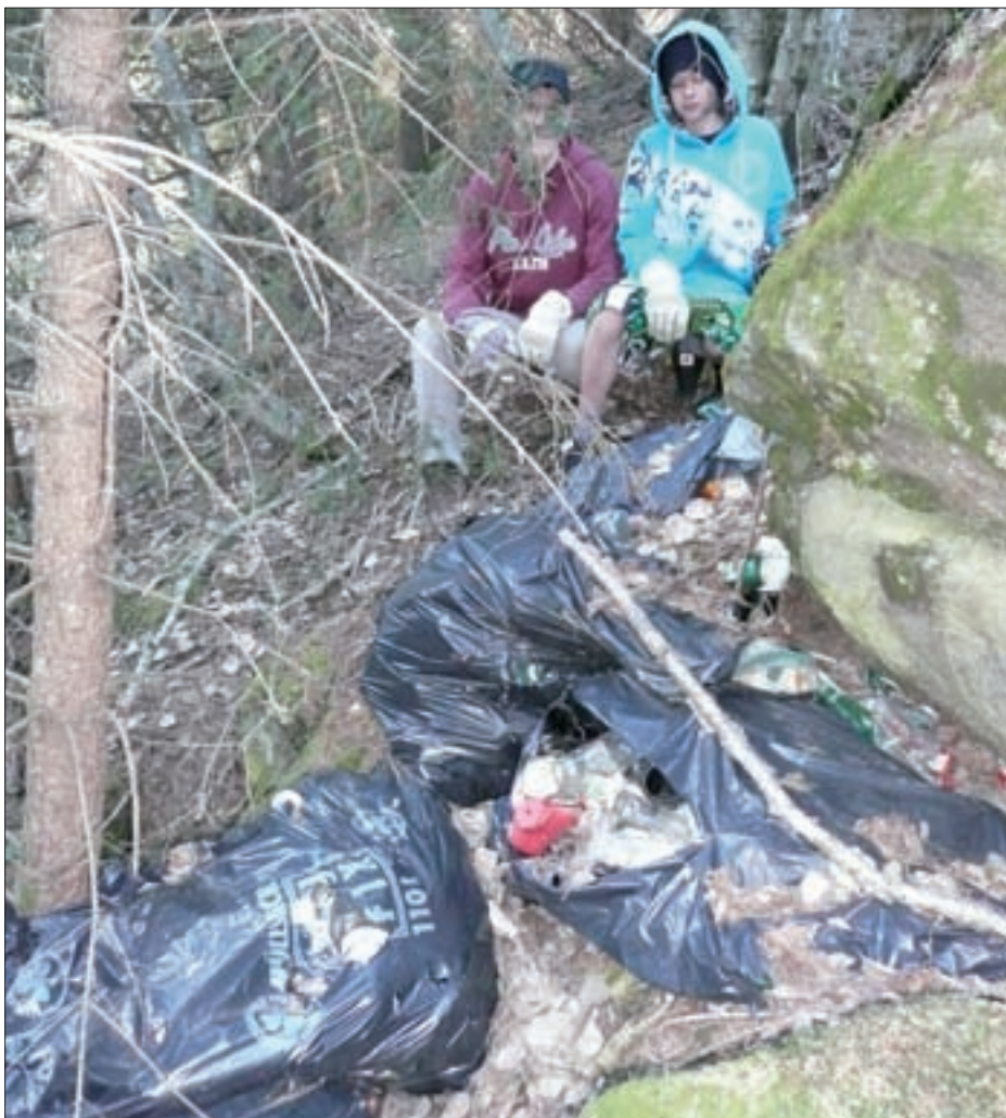
Die Nationalpark-Ranger führten mit Schülern der Polytechnischen Schule Matriei die Flurreinigung durch.