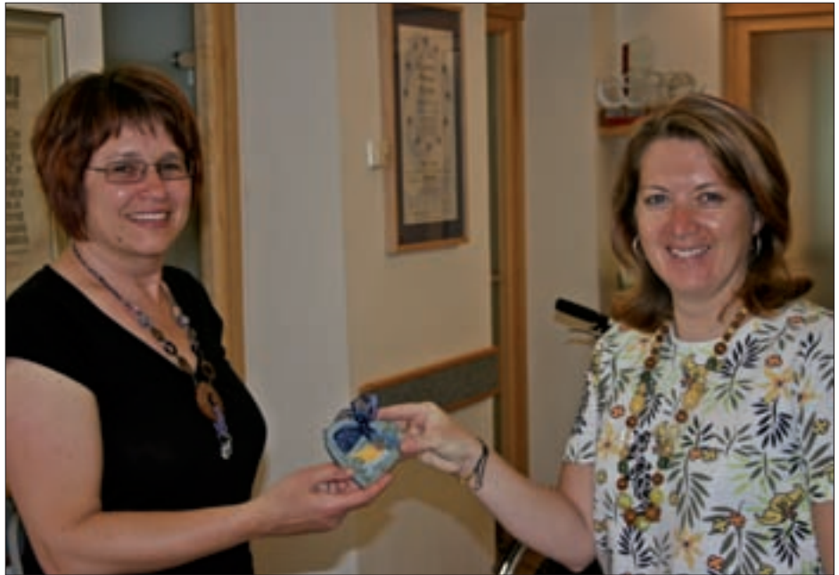
Heuer bekamen die Mütter ein Keramik-Herz als kleine Anerkennung zum Muttertag.

Es ist in Virgen schon Tradition, dass die Gemeinde den Müttern alljährlich zum Muttertag ein „Danke“ ausspricht – ein Danke von offizieller Seite, das auch die wichtige Rolle der Mutter in unserer Gesellschaft hervorheben und würdigen soll. Ob Ausflüge, Feiern oder Gutscheinkaktionen – wir bemühen uns stets um Abwechslung, sodass für jede Frau einmal das „Richtige“ dabei ist. Heuer konnten sich unsere Virger Mütter ein kleines Herz aus Keramik vom heimischen Keramiker im Gemeindeamt abholen.