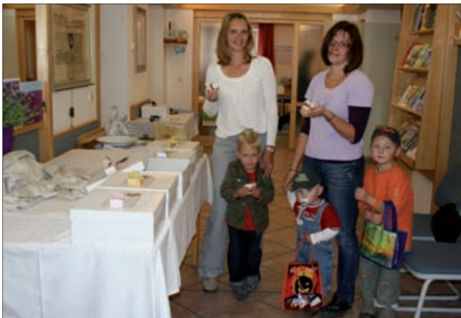
Die Mütter konnten ihr Geschenk im Gemeindeamt auswählen.