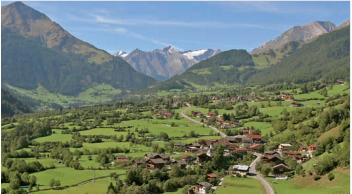
Der dörflichen Entwicklung liegt ein Raumordnungskonzept zu Grunde.