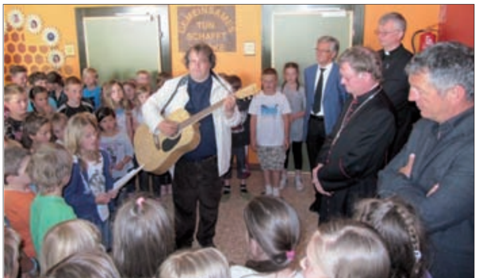
Herzlicher Empfang in der Volksschule.

Am Nachmittag fand im Pfarrsaal eine feierliche Messe mit Krankensalbung statt. Bei Kaffee und Kuchen konnte man sich in geselliger Runde mit dem Bischof unterhalten. Auch ein Besuch im Kloster stand auf dem