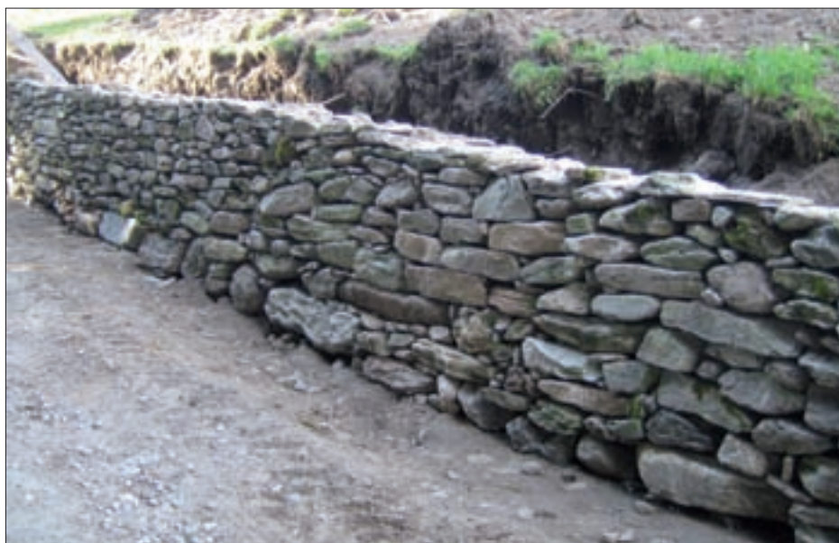
Landesweit wird die Erhaltung und Neuanlage von Trockensteinmauern und Lesestein- riegel gefördert.

Angeboten werden weiters spezielle ÖPUL-Förderungen als Standardför- derungen zur Erhaltung und Pflege von Kleinstrukturen sowie den Erhalt und die schonende Bewirtschaftung von Heckenzügen und Lesestein- mauern in besonderen Projektgebie- ten (Blaufächengebieten).