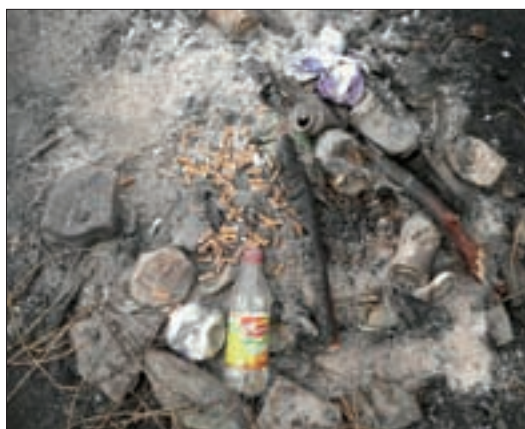
Ein verlassener Fetenplatz.

Anders in Obermauern „hinter den Zäunen“. Bei den zwei Grillplätzen kamen mehrere Alubehälter, die als