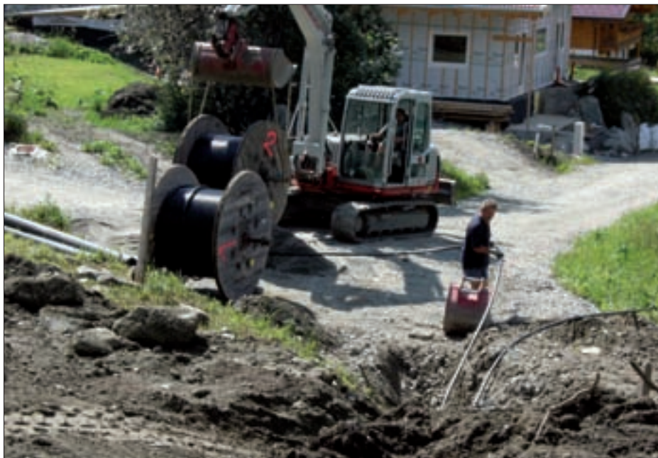
Verkabelung 30-KV-Leitung in Haslach.

Wie bereits im Vorjahr angekündigt, hat die TIWAG die letzten Wochen