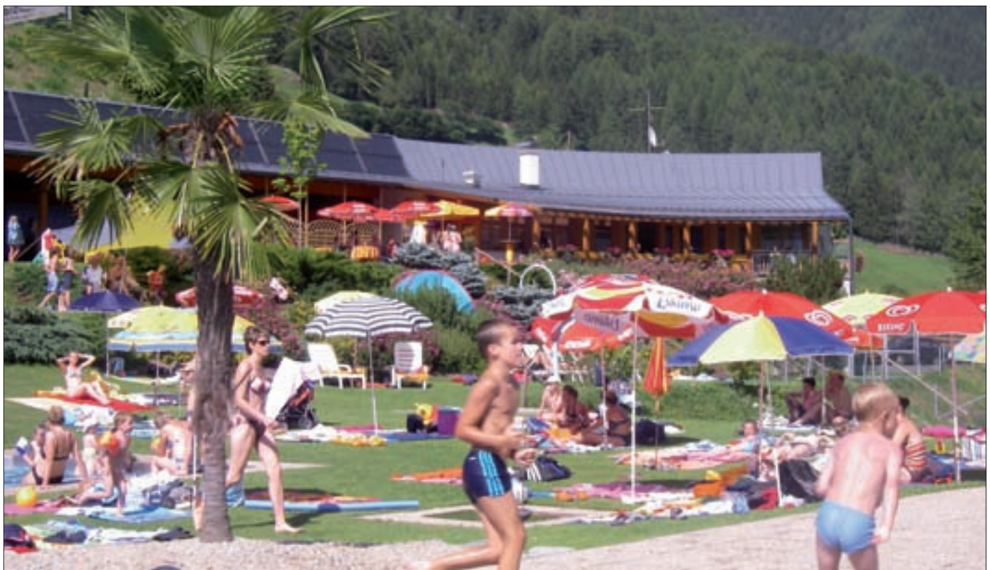
Badewetter gab es im heurigen Jahr noch kaum.