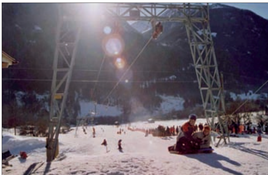
Ist der Virger Schilift für VirgerInnen noch attraktiv?

Der Großteil der Osttiroler Gemeinden hat beschlossen, im Bereich der EDV-Gemeindelösungen in Zukunft verstärkt zusammenzuarbeiten. 29 von 33 Gemeinden nehmen an diesem interkommunalen Projekt teil. Die Gemeinden arbeiten mit zukunftsorientierten Gemeindeprogrammen der Fa. ÖKOM und werden von der EDV-Abteilung des Bezirkskrankenhauses Lienz sowie dem Vermessungsbüro Neumayr (GIS) hochwertig betreut. Diese Gemeinschaftslösung hilft den Osttiroler Gemeinden Kosten zu sparen, gewährt ein hohes Maß an Service und Transparenz und ermöglicht allen Gemeinden Osttirols einheitliche Standards. Ich freue mich besonders über diese Lösung, da ich als Obmann des Gemeindeverbandes Bausachverständige und Steuerprüfer maßgeblich zum Gelingen beigetragen habe.