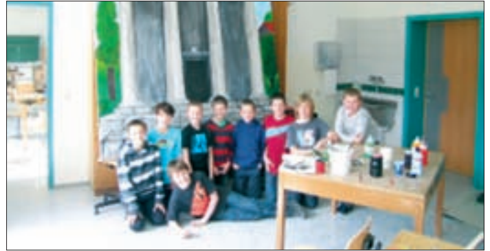
Knaben der 1. Klasse basteln eine römische Kulisse.