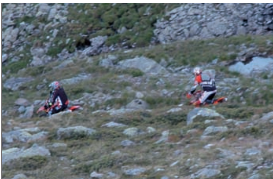
Laut Tiroler Feldschutzgesetz 2000 ist das unbefugte Befahren landwirtschaftlicher Grundflächen verboten.

die Verwendung von Kraftfahrzeugen, ausgenommen im Rahmen der üblichen land- und forstwirtschaftlichen Nutzung, der Instandhaltung von Straßen und Wegen, der Wildfütterung, der Viehbergung, der Versorgung von Vieh in Notzeiten, der Ver- und Entsorgung von Almen, Schutzhütten und Berggasthöfen, der wissenschaftlichen Forschung, der Sanierung von Schutzwäldern, der Instandhaltung von Rundfunk-, Fernmelde-, Energieerzeugungs- und Energieverteilungsanlagen, sofern der angestrebte Zweck auf eine andere Weise nicht oder nur mit einem unverhältnismäßig