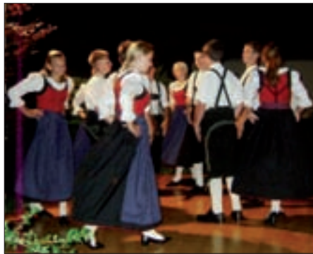
Die jungen Volkstänzer.

In der Folge begeisterten sie vor allem bei Heimatabenden, Bezirkstrachtenfesten und Wiesenfesten das heimische Publikum und Touristen aus unserer Region.