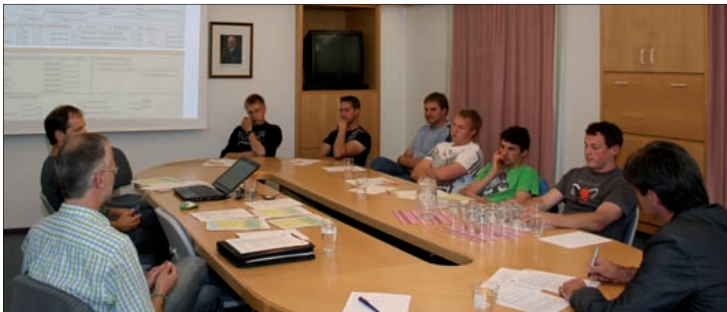
Mitglieder der Landjugend/Jungbauernschaft führen die Fragebogenaktion durch.