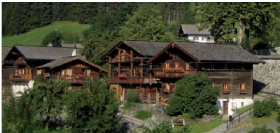
Das Land Tirol fördert die Sanierung alter Bausubstanz.

Das Land Tirol fördert die sachgemäße Sanierung alter Bausubstanz. Historische Bausubstanz ist ein wertvoller Teil der Geschichte unseres Landes. Sie ist nicht nur Zeitzeuge, sondern prägt auch als ein Identifikationsmerkmal besonders die Landschaft und unsere Gemeinden. Es gilt, sie zu erhalten und zu pflegen. Mit dem Verlust der alten Gebäude verlieren die Gemeinden an Attraktivität und Charakter. Immer öfter