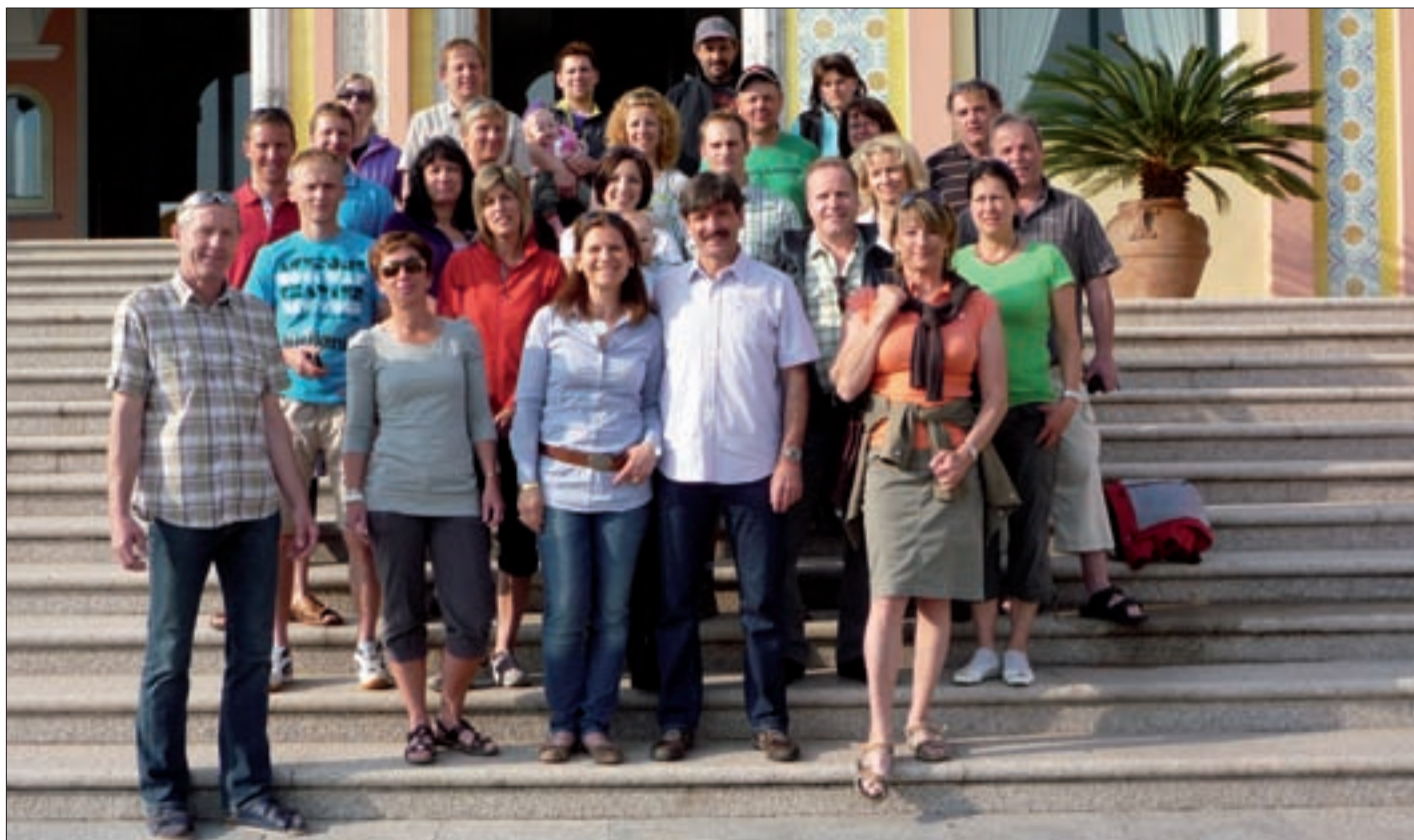
Die Reisegruppe auf Sardinien.