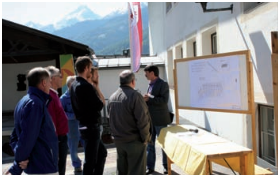
Vorstellung des Kraftwerk-Projektes am Tag der Sonne.

Windenergieparks und bei Wasserkraftwerken beteiligen, die Sonnenstrom fordern – die Kosten dafür aber nicht begleichen wollen. Sonnenenergienutzung ist für mich in höchstem Maße sinnvoll. Derzeit sind die Technologien dafür noch völlig unwirtschaftlich. Solarstrom kostet in der Produktion derzeit ein Vielfaches (ca. fünf- bis siebenfach), verglichen mit Strom aus Wasserkraft. Es gibt kaum ein Thema bei dem so doppelbödig agiert und argumentiert wird, wie bei Energie. Energiesparen – dazu sind wir alle in hohem Maße verpflichtet und gefordert. Jeder ist gefordert bei sich und nicht beim Anderen zu beginnen. Die Beschlüsse Österreichs ab 2015, keinen Atomstrom mehr zu beziehen, der Atomausstieg Deutschlands bis 2022, die Beschlüsse in der Schweiz in Planung befindliche Kernkraftwerke nicht zu realisieren und bis 2034 aus der Atomenergie auszusteigen, das Referendum in Italien, das sich gegen neue Atomkraftwerke richtet, bedeuten, dass in Europa sehr viel Energie trotz massiver Einsparungen produziert werden muss. Diese Szenarien werden zu empfindlichen Teuerungen bei den Energiepreisen führen. Bei uns bietet sich die Wasserkraft und Sonnenenergie an. Wind ist kein interessantes Potential – das ergeben die langjährigen Daten unserer Klimastation eindeutig. Viele Regionen streben Energieautarkie an. Wir könnten uns zu einer Plusenergieregion entwickeln.