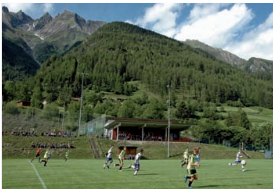
Die neuen Kabinen am Sportplatz sind in Betrieb.

Damit die Turnerinnen überhaupt an Wettkämpfen teilnehmen dürfen, muss jeder Verein auch Kampfrichter