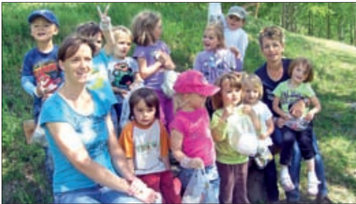
Kindergartenkinder (l.) und Volksschulkinder (r.) beim Müllsammeln in den Virger Feldfluren.