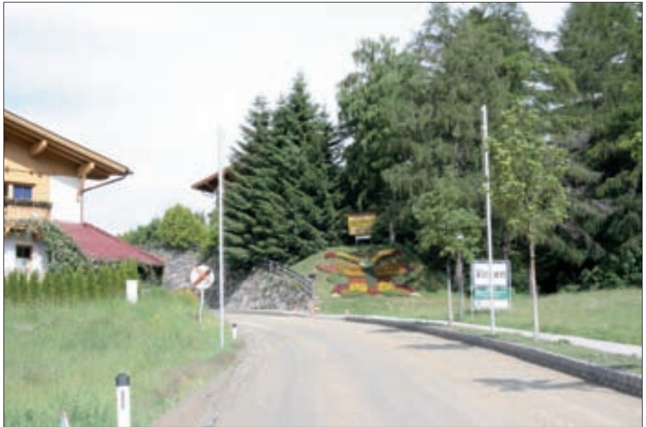
Die Landesstraße zwischen Virgen und Mitteldorf wurde neu asphaltiert.