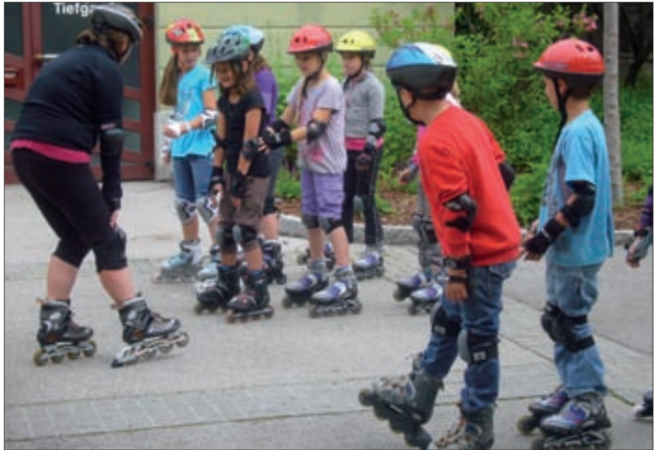
Richtiges Inlineskaten will gelernt sein.

Die Volksschule beteiligte sich wiederum am traditionellen Frühjahrsputz. ▼