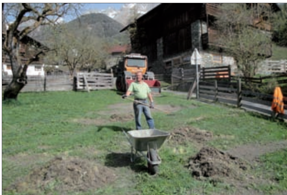
Schäden, die durch die Schneeräumung entstanden sind, wurden im Frühjahr seitens der Gemeinde behoben.