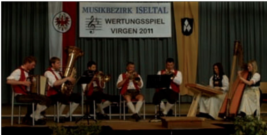
Die Gruppe „Irschner Bloss“ sorgte für hervorragende Unterhaltung und Stimmung.

Die MK Virgen möchte alle Blasmusikfreunde herzlichst zu den Sommerkonzerten 2011 auf dem Virger Dorfplatz einladen.