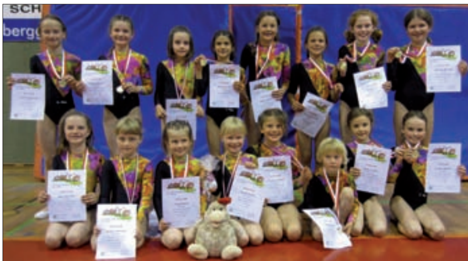
Die erfolgreichen Teilnehmerinnen an der Tiroler Meisterschaft.