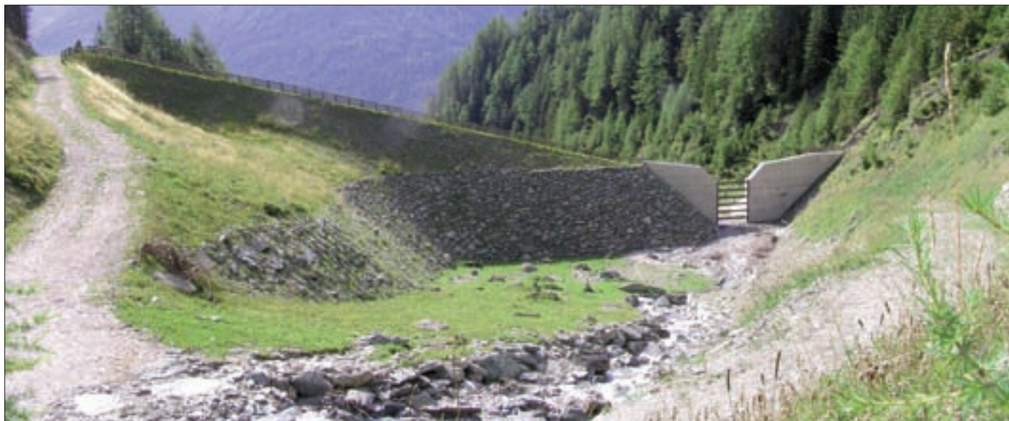
Mellitzbachverbauung zum Schutz der Ortschaft Mellitz.

Die fachliche und finanzielle Kollaudierung dieses Projektes wurde im März 2011 durchgeführt. Die Gesamtkosten für die in diesem Zeitraum durchgeführten Maßnahmen betragen 1,375.000 €, die vom Bund zu 61 %, dem Land Tirol zu 23 % und der Gemeinde Virgen zu 16 % getragen wurden. Die Zuständigkeit für die Instandhaltung und Überwachung dieser Verbauungsmaßnahmen liegt nun bei der Gemeinde.