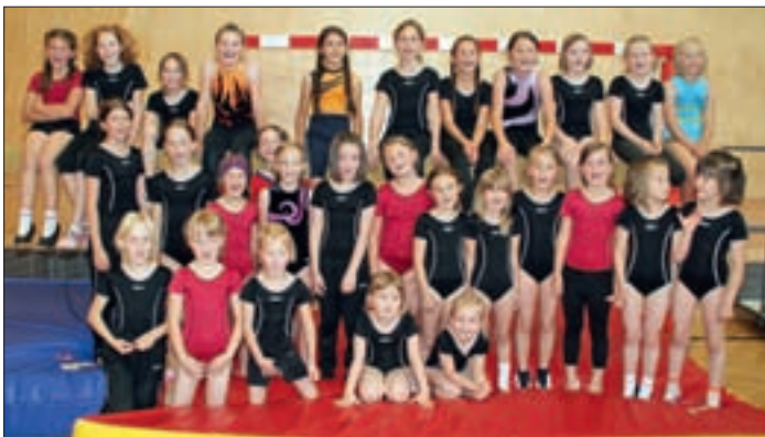
Die eifrigen Turnerinnen...