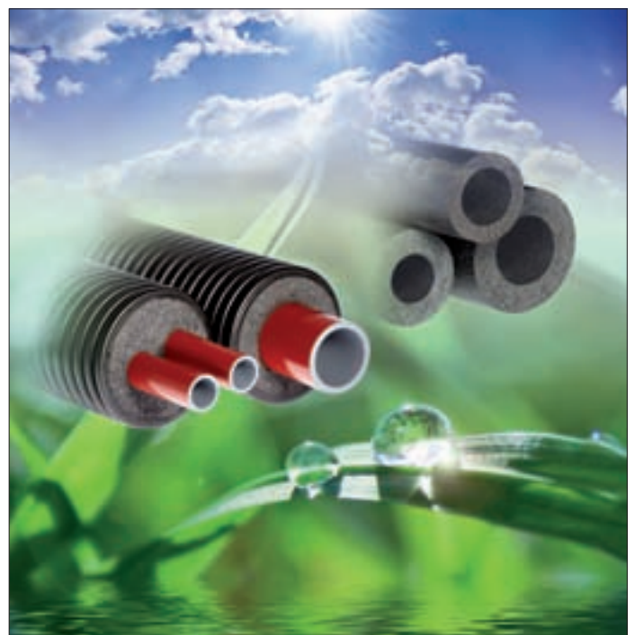
Messe Frankfurt 2011: Hauptmotiv „Thermafex“ NL, (Vorisierte Rohre für Fern-Wärme und -Kühlung), 4 x 5 m.