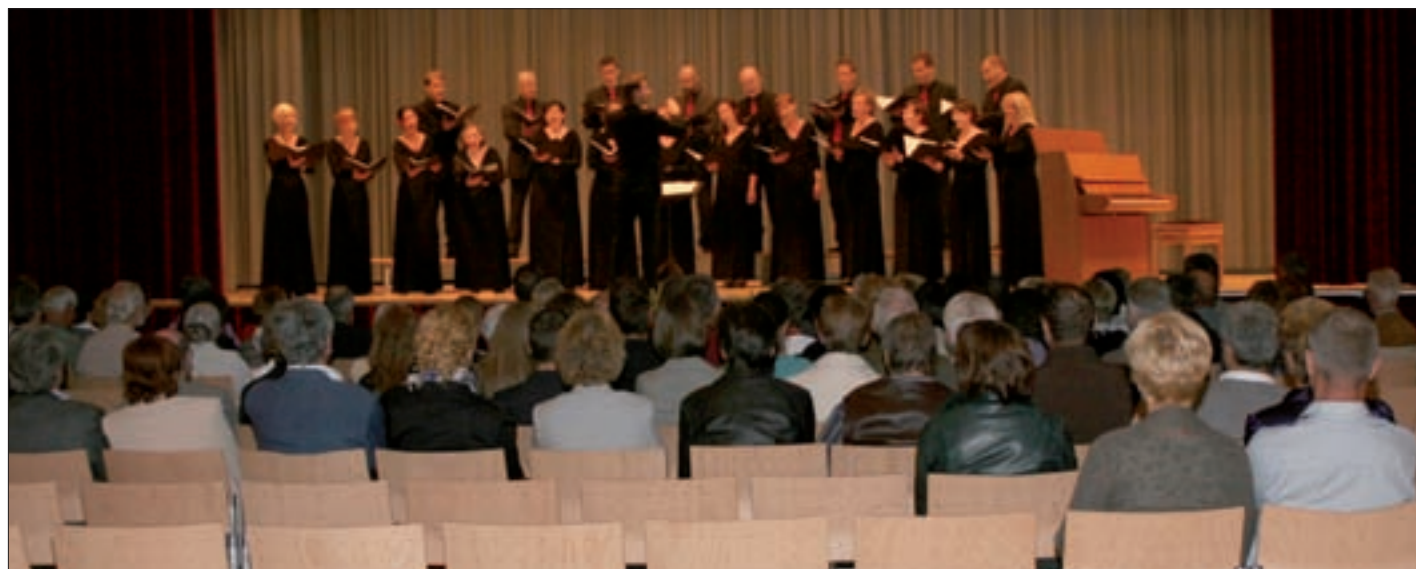
Das Konzert des Kammerchor vokalissimo Lienz im Kultursaal war ein besonderes Klangerlebnis.

bunte Mischung aus Werken verschiedenster Stilrichtungen – bekanntes aus Film, Musical und Volkslied war ebenso zu hören sein, wie klassische Werke oder Jazz.