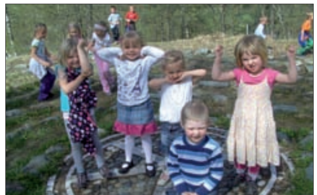
Auch die Kindergartler machen gerne einen Ausflug ins Labyrinth.

Wenn jemand bereit wäre und Zeit hätte bei der Pflege des Labyrinths mitzuhelfen, z. B. zwei- bis dreimal im Sommer mähen helfen, bitte melden!!!