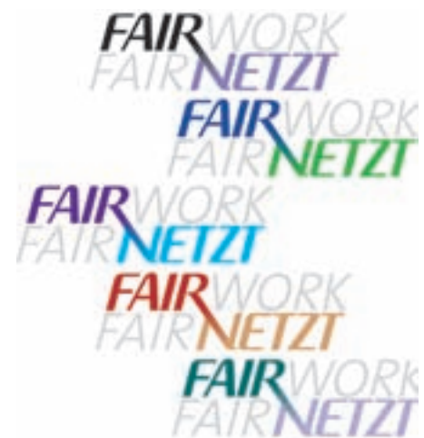
Bewährtes und Neues, was im Laufe der Jahre im Atelier Wurnitsch entstanden ist.