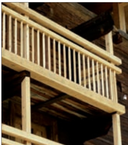
Traditionell sanierter Balkon.

steht alte Bausubstanz leer und verfällt oder wird abgetragen, während am Ortsrand Neubauten entstehen. Auch gut gemeinte aber unsachgemäße Sanierung verursacht Schaden an diesen Gebäuden. Sensibler Umgang mit alter Bausubstanz schließt Wohnkomfort nicht aus. Das Land Tirol unterstützt Besitzer bei der Erhaltung von alten Gebäuden durch Beratung und finanzielle Zuschüsse. Neben charakteristischen Wohngebäuden können auch andere historische Bauobjekte wie Städel, Mühlen, Kornkästen, Backöfen, Harpfen, Holzbauwerke als Förderobjekt in Frage kommen. Dazu ist eine Ab-