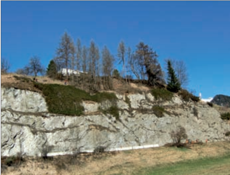
Zur Sicherung der darunter liegenden Gemeindestraße wurden von unseren Gemeindearbeitern „unterm Palfen“ loser Felsen abgeräumt und zahlreiche Bäume gefällt.

Die Kindergarteneinschreibung ergab den Bedarf, im kommenden Jahr 73 Kinder zu betreuen. (54 Kinder im Alter von vier bis sechs Jahren und 19 dreijährige Kinder.) Ein Kind erhält Integrationsbetreuung. Dieses Ergebnis stellt uns vor räumliche Herausforderungen. Vier Gruppenräume sind erforderlich. Mehrere Besprechungen mit Kindergärtnerinnen, Volksschuldirektor und Hauptschuldirektorin fanden statt. Optimal wurde die Adaptierung des Handwerksraumes der Volksschule gesehen. Dieser befindet sich auf Kindergartenerebene und soll nun zu einem Kindergartengruppenraum mit dazugehörigen Garderoben und Nassräumen umgebaut werden. Das bedeutet, dass