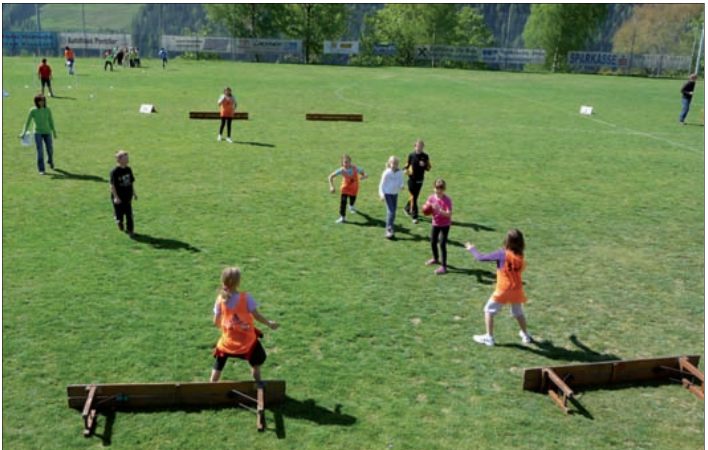
Junior-Cup auf dem Sportplatz.

Wie jedes Jahr wurden alle Schüler der Volksschule von der Raiffeisenbank zum lustigen Junior-Cup auf dem Sportplatz eingeladen. Auf diesem Wege bedankt sich die Schule für die gute Zusammenarbeit und diversen Unterstützungen!