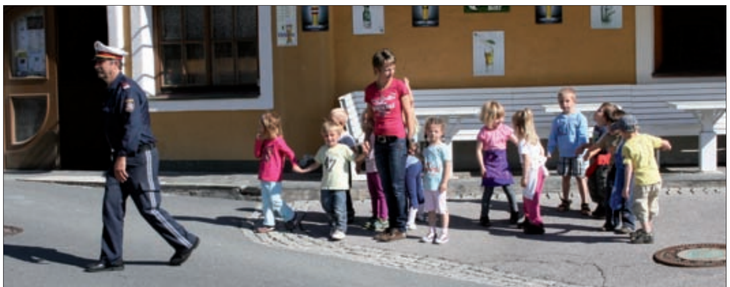
Verkehrserziehung mit einem Polizeibeamten.

Das Kindergarten-Team wünscht allen Kindern und Eltern einen er- holsamen, schönen Sommer!