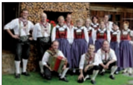
Die Jubiläums-Volkstanz- und Plattlergruppe 2011.