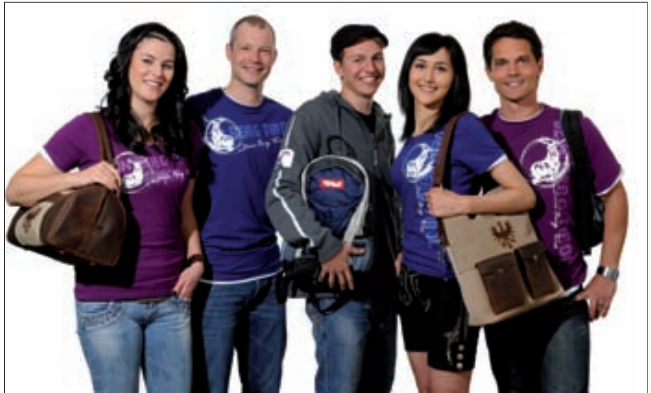
Sportlich, funktionell, anziehend ...