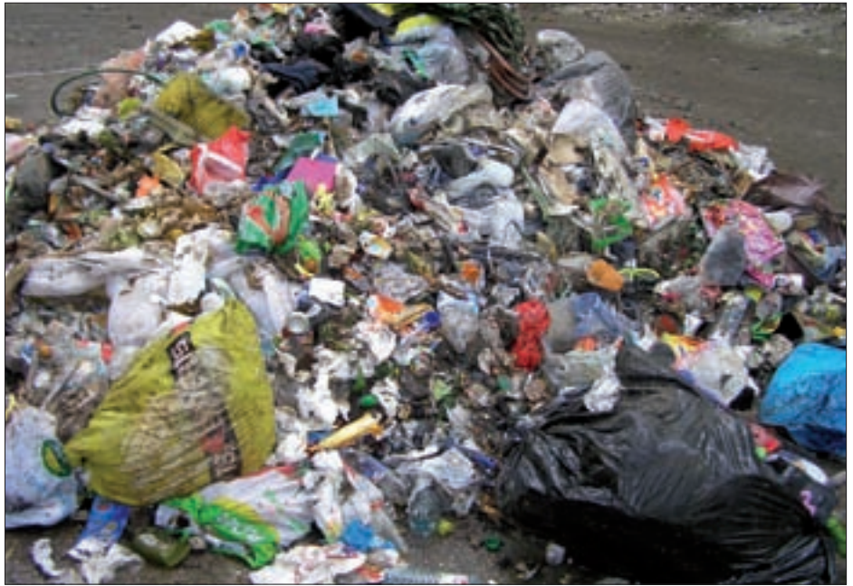
2012 soll eine neue Müllordnung in Kraft treten.

Die Gemeindeverwaltung erarbeitet gemeinsam mit dem Abfallberater des Abfallwirtschaftsverbandes Osttirol ein System für eine zukunftsfähige Abfallentsorgung für Virgen. Ziel ist eine deutliche Reduktion der Restmüllmengen. Analysen und Erhebungen wurden durchgeführt. Diese ergaben hohes Einsparpotential bei besserer Mülltrennung. Voraussichtlich wird die vorgegebene Müllmenge je Person deutlich reduziert. Das ergibt für einen Großteil der Haushalte geänderte Abfuhrintervalle und die Verwendung von Müllsäcken anstelle der Müllcontainer. Unsere Prognoserechnungen ergeben Einsparungen von mindestens 20.000 € pro Jahr. Damit könnten wir die jährlichen Abgänge im Bereich des Haushaltspostens Müll großteils