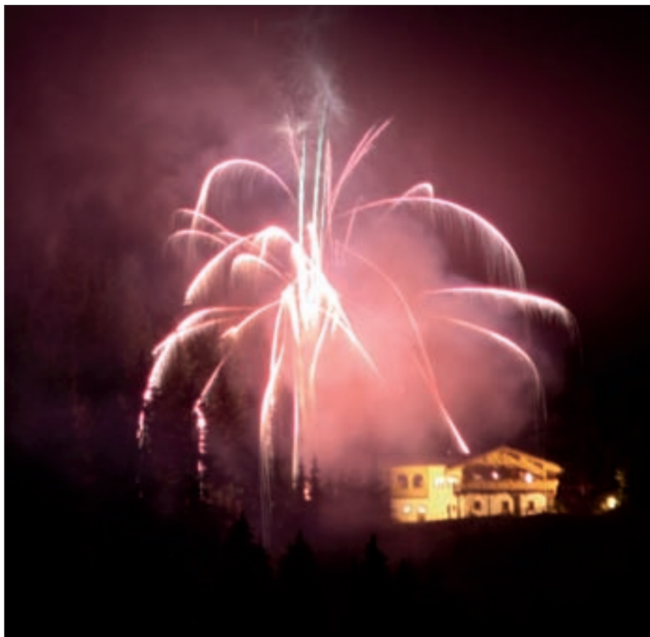
Großartiges Feuerwerk auf der Würfelehütte.