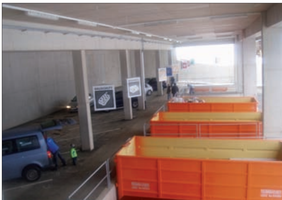
Im Recyclinghof wurde eine Besuchererhebung durchgeführt.

Neben diesem positiven Aspekt, darf aber nicht außer Acht gelassen werden, dass 19,6 %, das sind 130 von 664 erfassten Haushalten, im Erhebungszeitraum den Recyclinghof nie besucht haben. Durch eine besonders schlechte „Trennungsmoral“ fallen hierbei die Ein- und Zweipersonen-Haushalte auf, welche fast zwei Drittel der oben genannten 19,6 % ausmachen. Dabei könnten durch