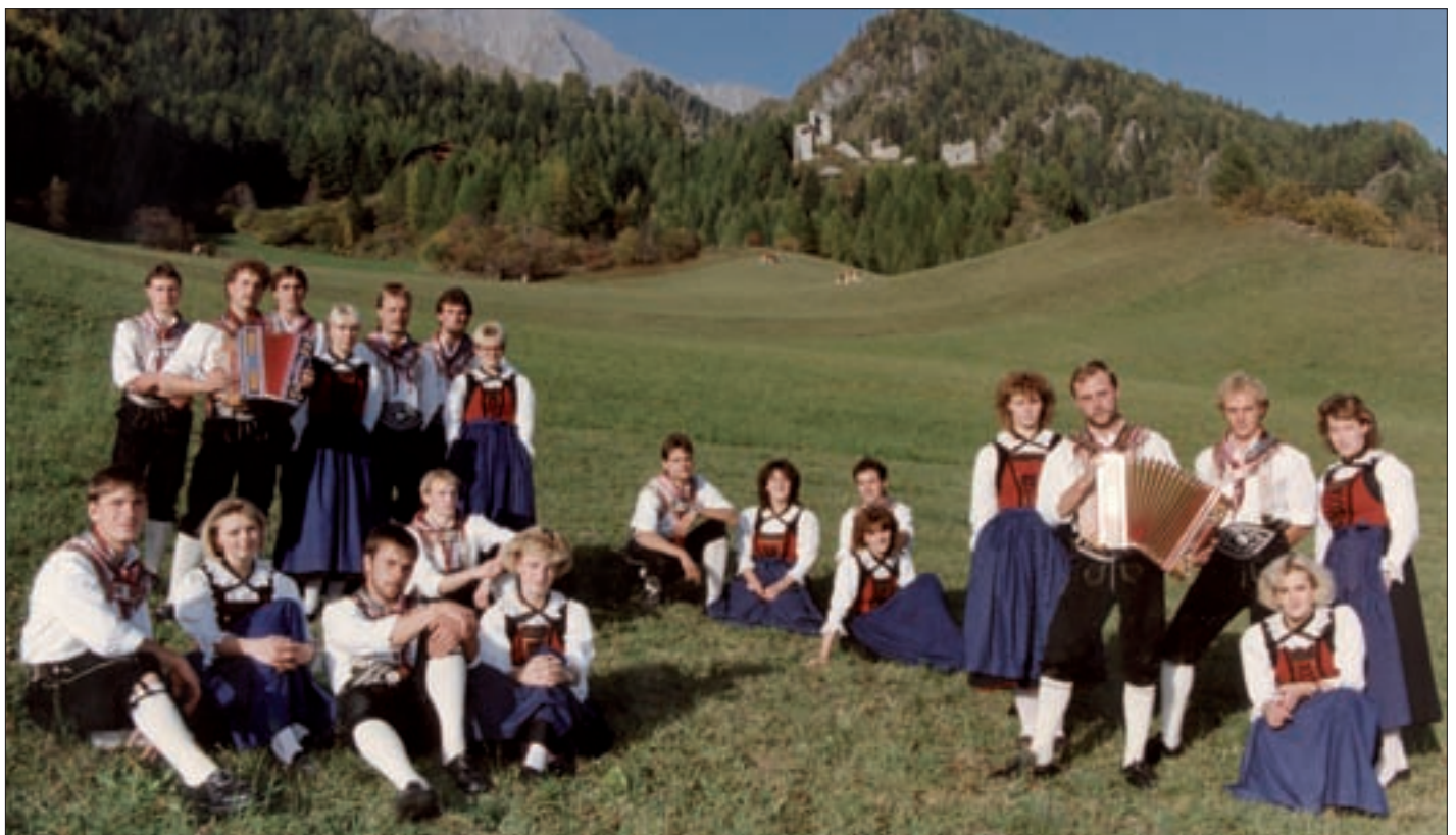
Die Volkstanzgruppe aus dem Gründungsjahr.

Zum 30-jährigen Jubiläumsball am 8. Oktober lädt die Volkstanz- und Plattlergruppe alle aus nah und fern recht herzlich ein!