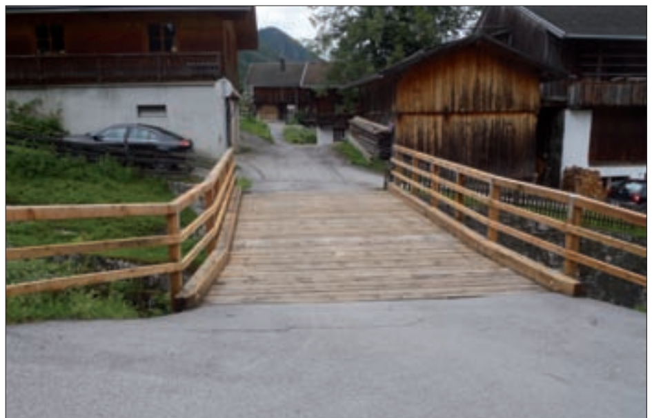
Die fertige Dorferbrücke in Obermauern.