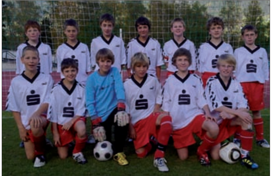
Die erfolgreiche Schülerliga-Mannschaft der Hauptschule Virgen.

Nur gegen die Kicker des heurigen Tiroler Meisters BG/BRG Lienz, die heuer zum ersten Male im Bundesfinale stehen, mussten sich die Fuß-