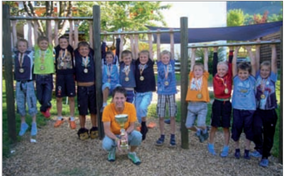
▲ Hervorragender dritter Platz für die Buben.