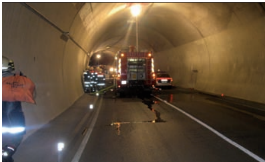
Zum Glück nur Übung – Fahrzeugbrand im Tunnel zwischen Virgen und Prägraten a. G.