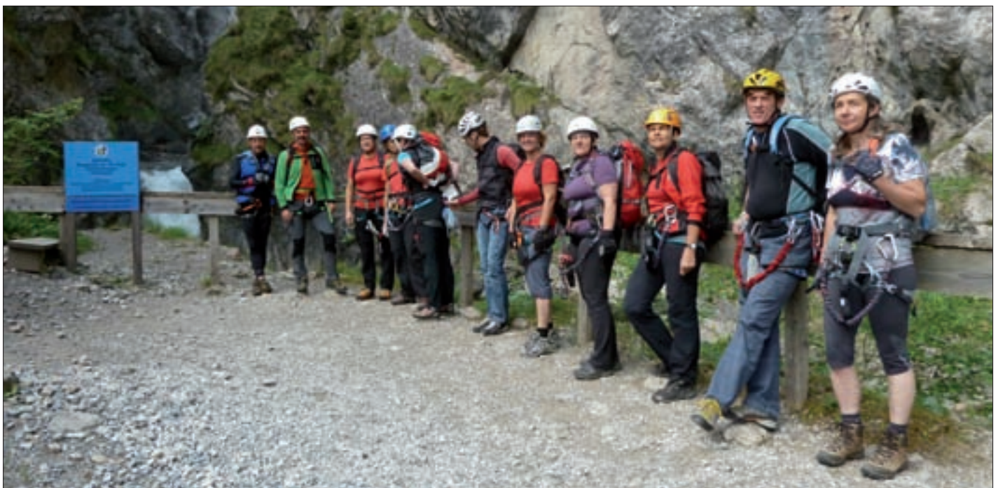
Ausflug der „50+ Klettergruppe“ in die Galitzenklamm.

p.s.: Besuche vital.vertikal auf facebook.com !