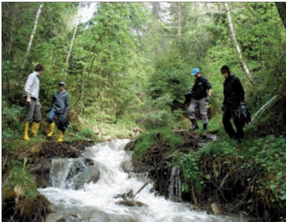
Die Jungschützen beim Säubern des Firschnitzbaches.

Die Freiwillige Feuerwehr Virgen, Jäger, Jungschützen, Parateam, Bergwacht, Golden Girls, Sportunion, Tourismusverband, Haupt- und Volksschule, die Polytechnische Schule Matri mit den Nationalpark-Rangern und der Kindergarten haben sich in diesem Jahr wieder be-