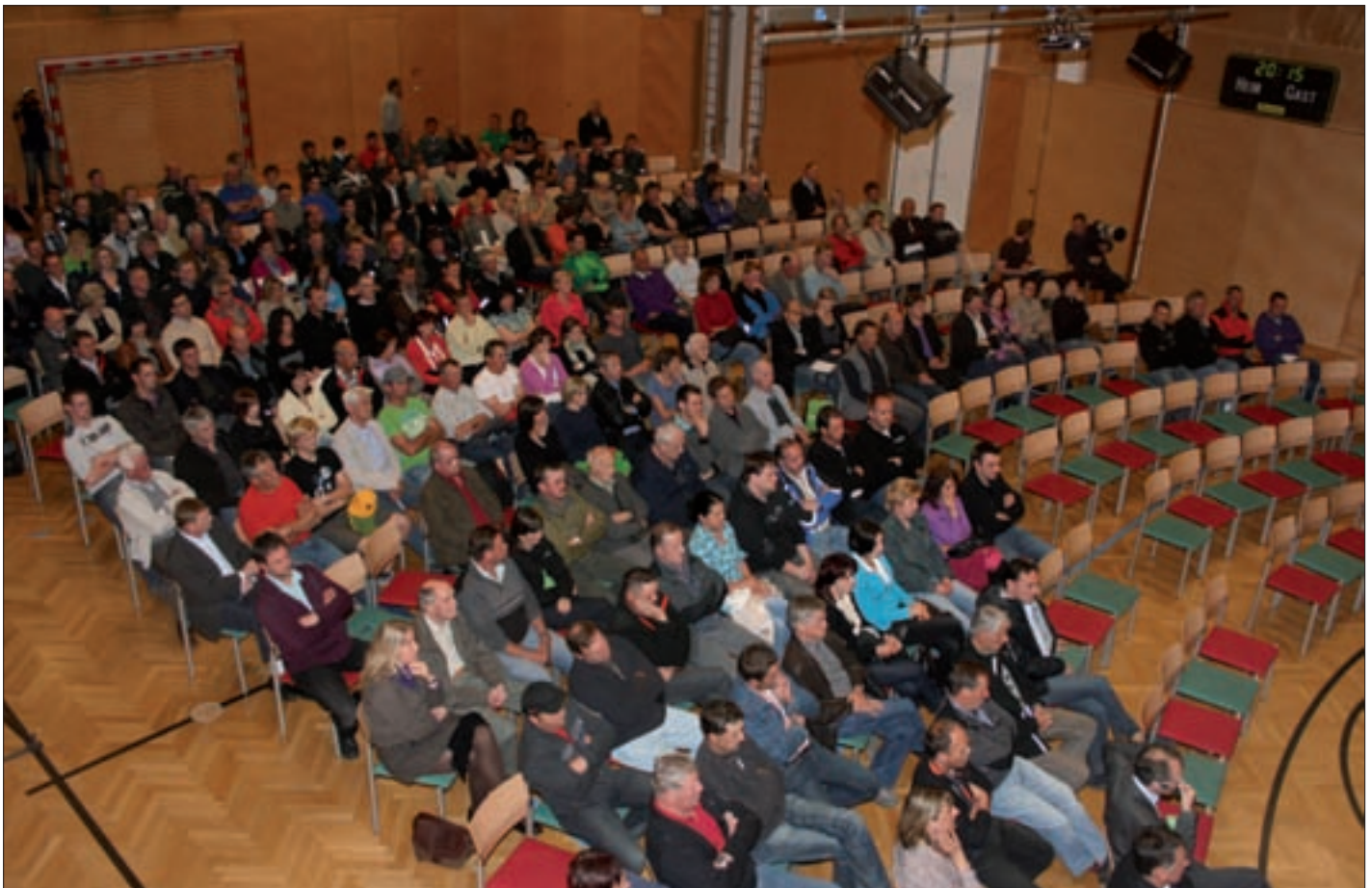
Informationsveranstaltung zum geplanten Kraftwerk Virgental im Virger Mehrzwecksaal.

zum geplanten Projekt Kraftwerk Virgental informiert. Diese Information darf ich in Erinnerung rufen. Am 8. April 2011 wurde das geplante Projekt im Mehrzwecksaal Virgen den interessierten BürgerInnen der Gemeinden Prägraten und Virgen öffentlich vorgestellt.