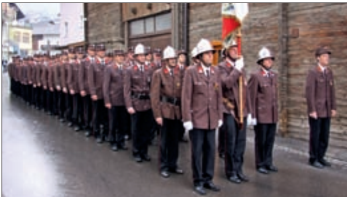
125 aktive Florianijünger (darunter vier Frauen) gehören derzeit der FFW Virgen an. Bei Leistungswettbewerben messen sie sich mit anderen Gruppen und erweitern so ihr Fachkenntnisse.