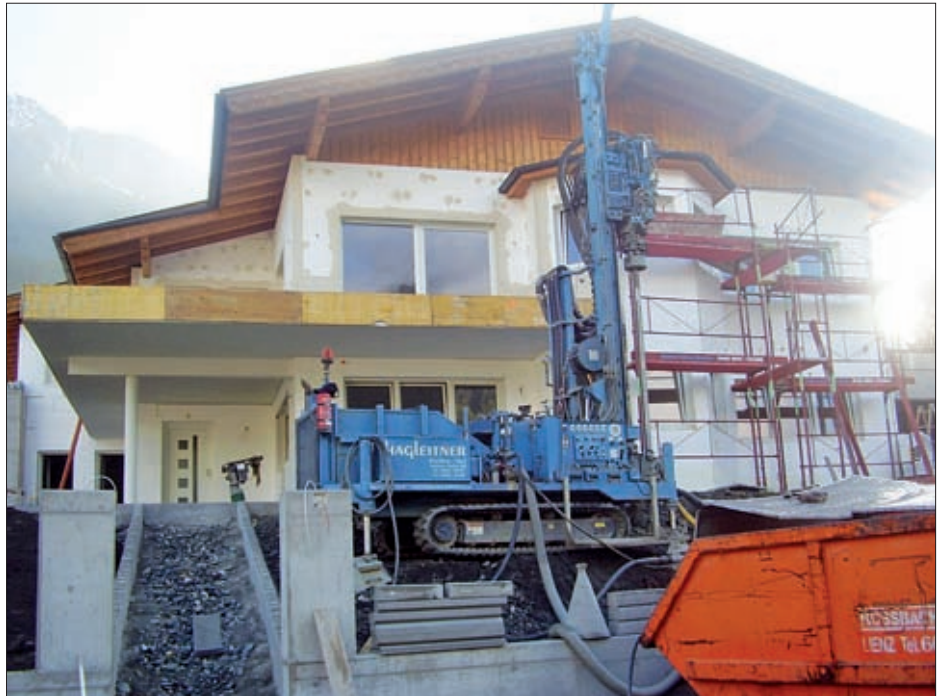
Tiefenbohrung für Wärmepumpenanlage.

Gefördert werden damit Maßnahmen bei Wohngebäuden zur Erhöhung des