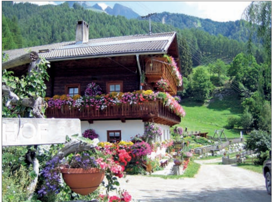
Virgen – das schönste Blumendorf Europas.