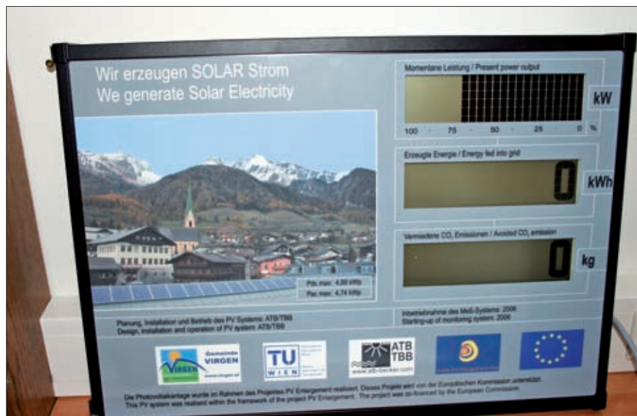
Messeinrichtung PV-Anlage Schule.