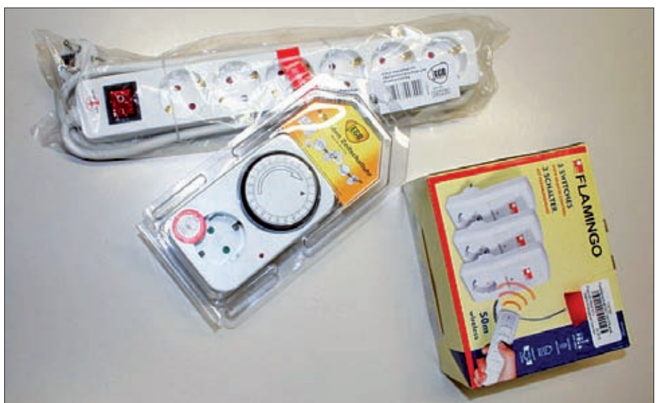
Einfache Hilfsmittel zur Reduzierung des Stromverbrauches.

Die Gemeinde Virgen verleiht kostenlos leicht verständliche Strommessgeräte. Mit diesen Geräten, die zwischen Steckdose und Kabelanschluss des Stromverbrauchers geschaltet sind, wird der Verbrauch an elektrischer Energie der Haushaltsgeräte gemessen.