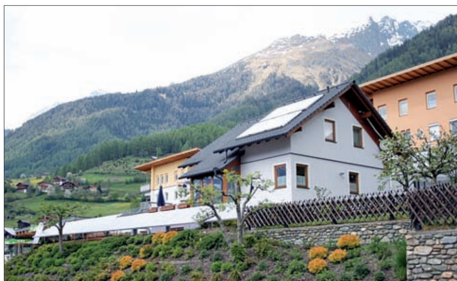
Photovoltaikanlagen gewinnen immer mehr an Bedeutung.

Als einmaliger Kostenzuschuss für den Einbau sowie den Ersatz der bestehenden