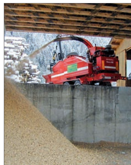
Hackschnitzel für Dorfwärme Virgen