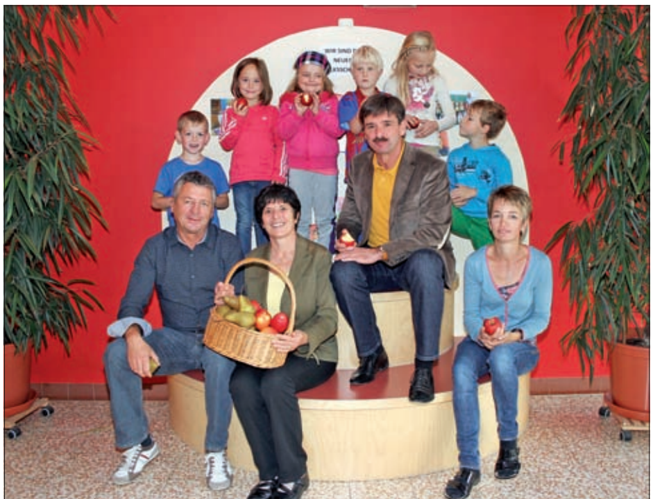
Schulobstaktion „Gesunde Jause“.