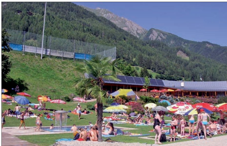
Beheizung Schwimmbad Virgen mittels Solaranlage.

In Zusammenarbeit mit Energie Tirol und Regionsmanagement Osttirol – die Termine werden auf der Homepage der Gemeinde Virgen und des Regionsmanagement Osttirol bekannt gegeben.