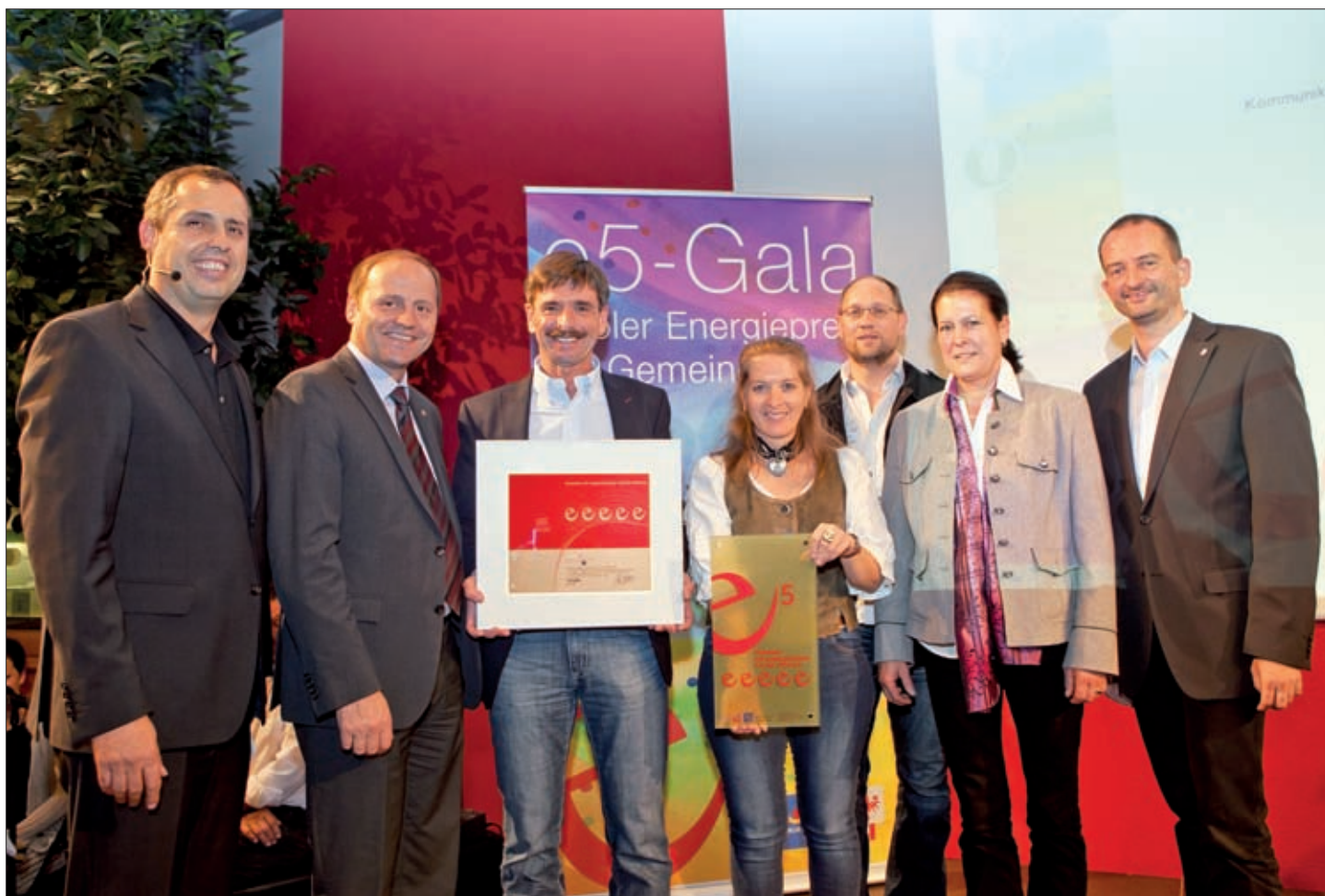
Verleihung des eea gold am 23. Oktober 2013.

SONDERAUSGABE DER „VIRGER ZEITUNG“, Jahrgang 2014 ANLÄSSLICH VERLEIHUNG EUROPEAN ENERGY AWARD® GOLD