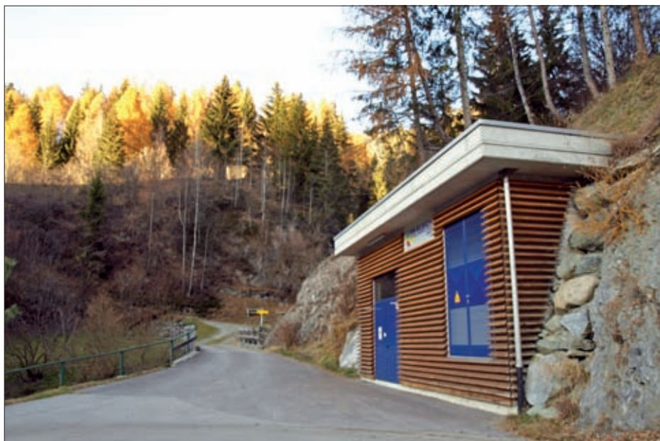
Kleinwasserkraftwerk am Nilbach.